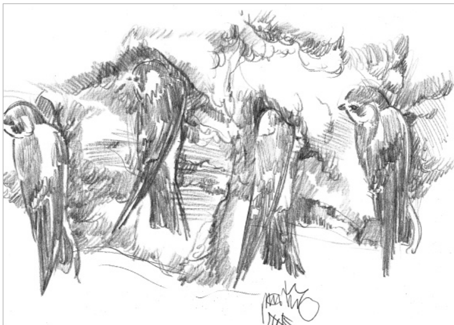
Péter László versillusztrációja