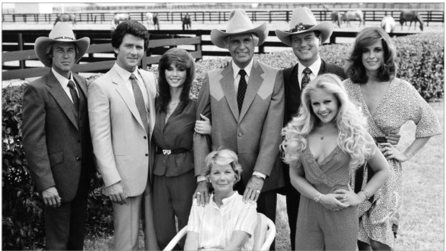
Csaknem fél évszázaddal ezelőtt, 1978-ban indult minden idők egyik legsikeresebb televíziós sorozata, a Dallas

Egy kicsit azonban térjünk még vissza a televíziózásra, tévénézési szokásaink megváltozására. A 2000-es években megszorodtak a televíziós csatornák, már nem csak az állami műsorszolgáltató műsorai voltak számunkra elérhetőek. Megjelent a kereskedelmi televíziózás, ezzel együtt a filmeket és műsorokat megszakító reklámblokkok, amelyek újdonságot jelentettek az akkori nézőnek. Ha van reklámozó, van pénz is. Ha nő a nézettség, lesz több reklámozó is. A műsorgyártók elsősorban ezt a szempontot tartották szem előtt. Ez viszont a minőség romlásával járt. Megjelent az úgynevezett trash, a