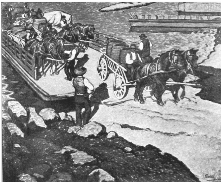
Pechán József: Szüret a Bácskában (PECHÁN 1912b)

Végezetül, 1913 decemberében a Művészház téli műtárlatán is a „szabad művészek csoportjában” Pechán is részt vett. Ott a Bocskorjavító Szarajevóban című nagyobb méretű képével hívta fel magára a figyelmet (TÉLI).