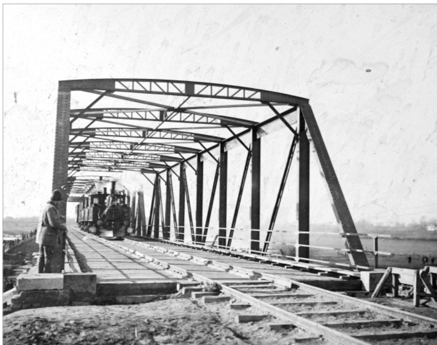
Az Ó-Bega feletti első vashidat Udvarnoknál 1898. október 19-én adták át a közúti és a vasúti forgalomnak

Fontos mérföldköve volt a térség történetének a déli megyéknek az anyaországhoz való visszacsatolása 1779-ben, amellyel a vidék rendezett közigazgatást kapott, majd a kamarai birtokok 1781-ben és 1782-ben megtartott árverése, amelyen több bánáti nagybirtok talált gazdára. A földbirtokosoknak azután gondoskodniuk kellett a hatalmas, több ezer, sőt tízezer holdas termőföldek műveléséről. S éppen a munkaerő biztosítása érdekében fogtak