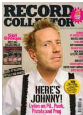
Record Collector 2005. novemberi szám borítója