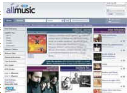
All Music Guide honlapja

Ennek értelme, hogy itt csak saját cd-tárunk darabjai jelennek meg. Előnye az egyszerűbb használat: minden előadóhoz és lemezhez egy-egy URL cím csatlakozik. Így egy klikkeléssel elérhető az Interneten a tételhez kapcsolódó weboldal és a lemezek borítói is megtekinthetők, amely sok esetben informatívabb, mint a szöveges leírás. Ahol ez lehetséges volt, ott behallgatási lehetőséget teremtettünk az egyes felvételekbe. Az általunk épített katalógus felénél ezek a szolgáltatások már működnek. Ezt kifejezetten igényelték a gyűjtemény használói. Ma már az olvasó ezeket a szolgáltatásokat otthon is élvezheti. A http://www.fszek.hu/ oldalon keresztül katalógusunk hallgatható is, nem csak nézhető. Ezeket nagyon sokszor kérték korábban használóink. Az általunk készített katalógusban a „műfaj” rovat bővebb tárgyszó felsorolásai segítenek egy-egy lemezt több szempont szerint is visszakereshetővé tenni, mert az általunk gyűjtött muzsikák ritkán sorolhatók csak egy műfajba és amellet precízebbé teszi a keresést, ezzel segítve a válogatót a pontosabb találatokhoz.