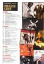
és tartalom- jegyzéke