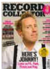
Record Collector 2005. novemberi szám borítója