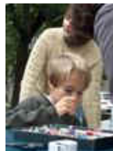
A fiúknak is megy!