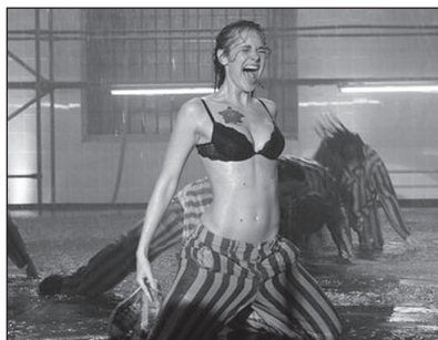
A legjobb zsánerfilm: jelenet a Valami Amerika 2. című filmből