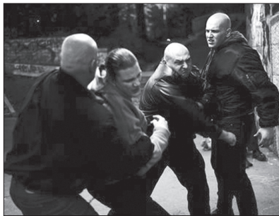
Erősök minden mennyiségben: jelenet a Papírrepülők című filmből

Fordított volt a helyzet Bacsó Péter Majdnem szűz című filmje esetében, ahol a testének áruba bocsátására kényszerített lány erkölcsi talpraállításának keserűes történetét az életműdíjjal kitüntetett Bacsó szakmailag szinte hibátlanul filmesítette meg, a végeredmény azonban mégis teljesen hiteltelen az alapos tényismeret hiánya, azaz az alvilágban uralkodó állapotok naivan romantikus lefestése miatt. A nyolcvanegy éves (és immár tolokocsihoz kötött Mester) filmjének mégis volt egy nagyon fontos hozadéka: új tehetséges színésznővel gazdagodott a legfiatalabb magyar színésznevedék. A Majdnem szűz főszereplője, az eddig ismeretlen Ubrankovics Júlia hiteles játékával kiérdemelte a legjobb női színészi alakítás díját.