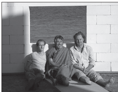
A digitális éhség áldozatai: jelenet az Adás című filmből

A Tréfánál is jóval nyíltabban vetette fel a gyermekkortól megfigyelhető erkölcsi válság, valamint a legfiatalabb korosztály körében is eluralkodó kegyetlenség és halálkultusz kérdését Sopsits Árpád, akit nagyszülei révén fűznek családi szálak a Vajdasághoz. Sopsits A hetedik kör című filmjében a kisközösségben élő gyermekek erkölcsi eltévelyedéséről készített láttelepet, azt elemelve, vajon létezik-e gyermeki ártatlanság, vagy a gonosz ott lakozik az ő lelkükben is. Az alkotók maguk is utaltak arra, hogy a film az elmúlt években Magyarországon megtörtént, megmagyarázhatatlannak tűnő tragikus események (a gyermekek körében történő egyéni vagy kollektív ön-