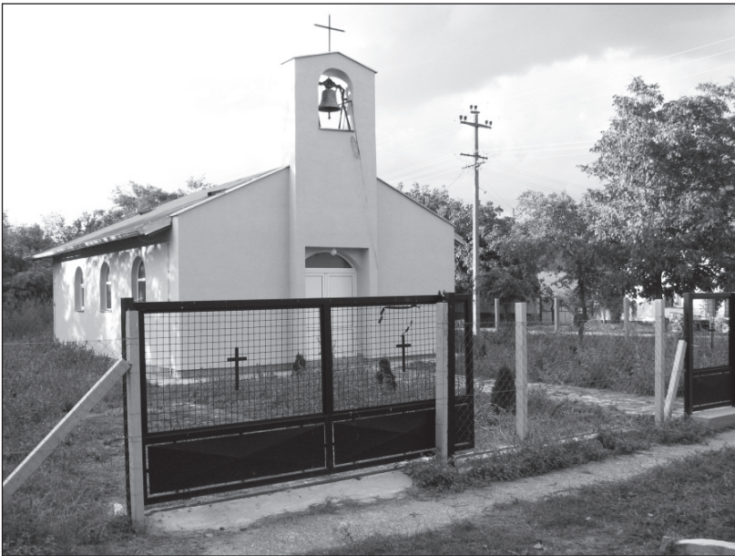
A katolikus templom és a mindentudó harang

– Itt havonta egyszer van mise, a hónap harmadik vasárnapján – közeledtünk óvatosan a beszélgetésünk végéhez. – De már úgy látszik, nincs is kinek misézni. A múltkor is csak ketten voltunk a templomban, egy idősenéni és jómagam – állapította meg a harangozó. – Nem kellemes se nekünk, hívőknek, de a miséző papnak se, hogy üres templomban prédikál. Pedig szép új templomunk van, 2010-ben építették újjá.