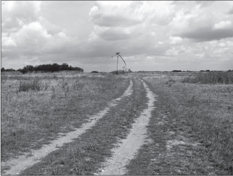
A surjáni puszta – Rózsa Sándor-rét

mindössze 32 lakott ház maradt meg. Ezt a kevés házat csatolták Torontál vármegyéhez, a Módosi járáshoz, majd manapság Torontálszécsány (szerb nevén Sečanj) községhez. Ennek a hányatott sorsnak még a Temes folyó áradó kedve sem vethetett véget. Amilyen gyorsan jött az árvíz, olyan gyorsan igyekeztek a kárt helyrehozni a szorgos kezű surjániak.