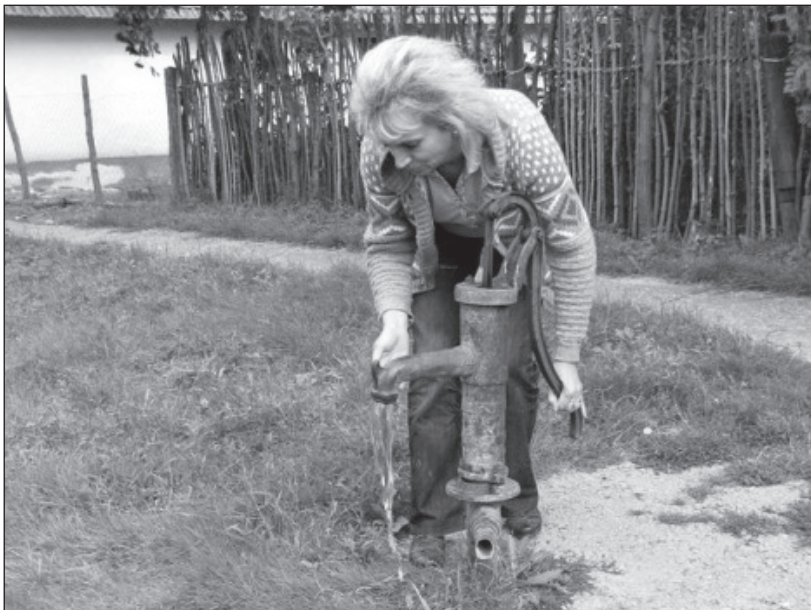
A surjáni pumpás kút

utcában egy pumpás kutat véltünk felfedezni. Iható, finom, sejtelmes ízű a vize. A kút csattogására az egyik házból egy férfi lépett ki. Fején új keletű sapka, cigarettával a szájában közelített felénk.