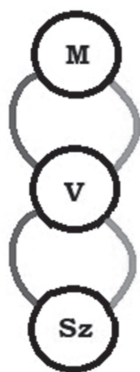
1. ábra. A magyar vajdasági irodalmi közeg a Görömbei András által meghatározott hídszerepben

Amennyiben az egyébként szintén háromtagú rendszer hídelemét kulturális kapcsolattartónak tekintjük, a Görömbei által használt közvetítés 2 félrevezető kifejezés lehet. Tudniillik a közvetítő közeg önálló kulturális működését háttérbe szorítja, mivel a leírás szerint az nem a saját kulturális információit küldi a másik két félnek, hanem a két másik szereplő kultúráját cseréli ki egymás között változtatás nélkül, anélkül, hogy saját elemet hozzájuk ad(hat)na. A Görömbei András által meghatározott hídszerep a magyar vajdasági irodalom középső pozíciójával (V) s a magyarországi (M), valamint a szerb (Sz) közeggel a két szélső pólusnál ekként írható le.