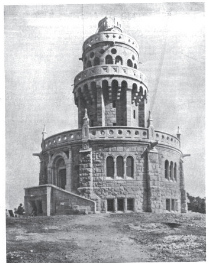
A JÁNOSHEGYI ÚJ KILÁTÓ-TORONY. — Jolly Gyula Híradók.