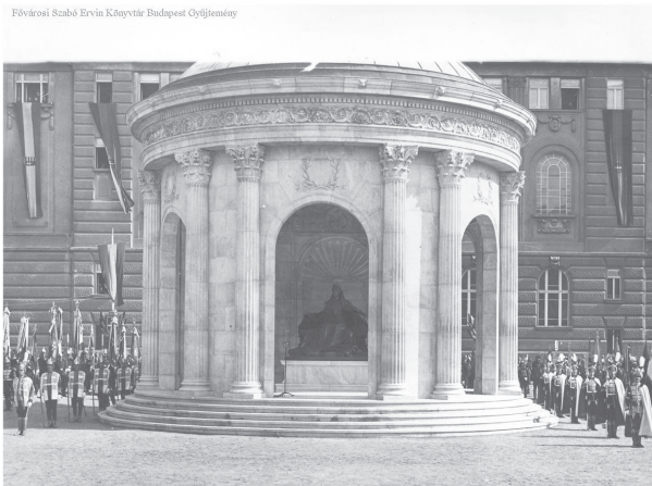
Fővárosi Szabó Ervin Könyvtár Budapest Gyűjtemény