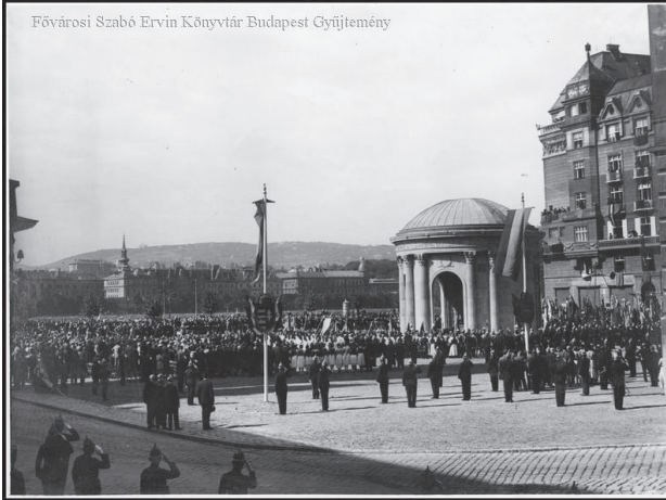
Fővárosi Szabó Ervin Könyvtár Budapest Gyűjtemény