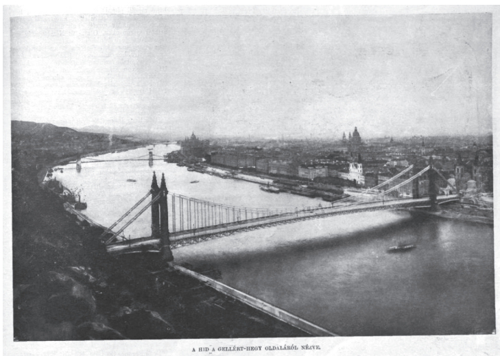
A HÍD A ORLLÉRT-HEGY OLDALÁRÓL NÉZVE.