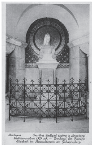
Budapest. Erzsébet királyné szobra a fánashegy kilitörvényben (1879 m.). — Denkmal der Königin Elisabeth im Aussichtsturm am Johannisberg. —