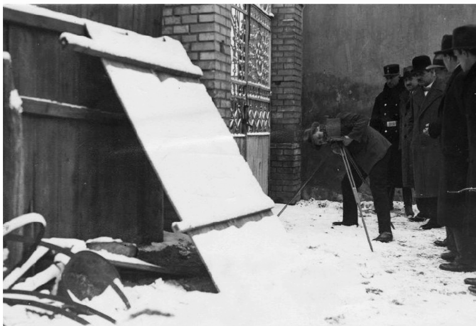
A kiscesti rablógylkosság helyszínelésén készült fotók