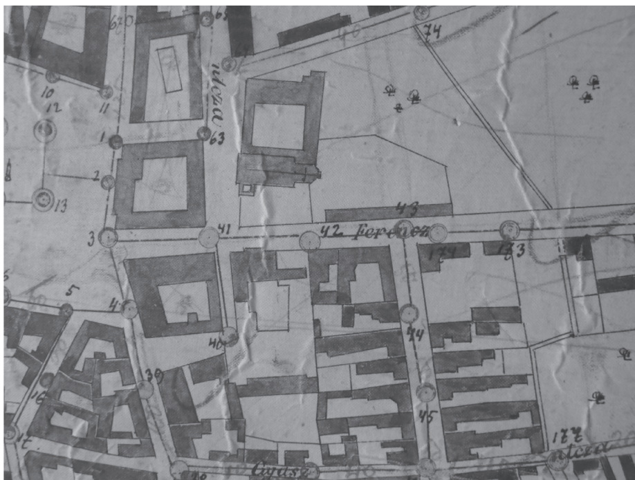
6. sz. ábra. Baja törvényhatósággal felruházott város... 44

(MNL BKML XV. 1. a. Baja 29-es térkép, a részleten a városháza mögött a ferencesek temploma és kolostora látható)