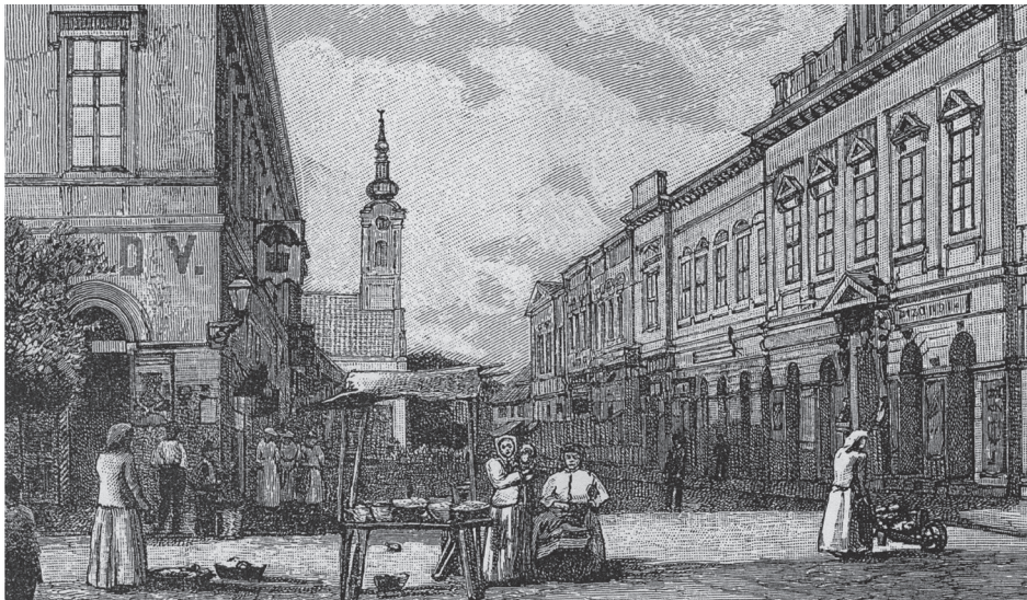
3. sz. ábra. A főtér és az Eötvös utca sarka bal oldalt a Pilaszánovits-házzal és egy sarki lámpával az 1880-as évek közepén (Az Osztrák–Magyar Monarchia írásban és képen )