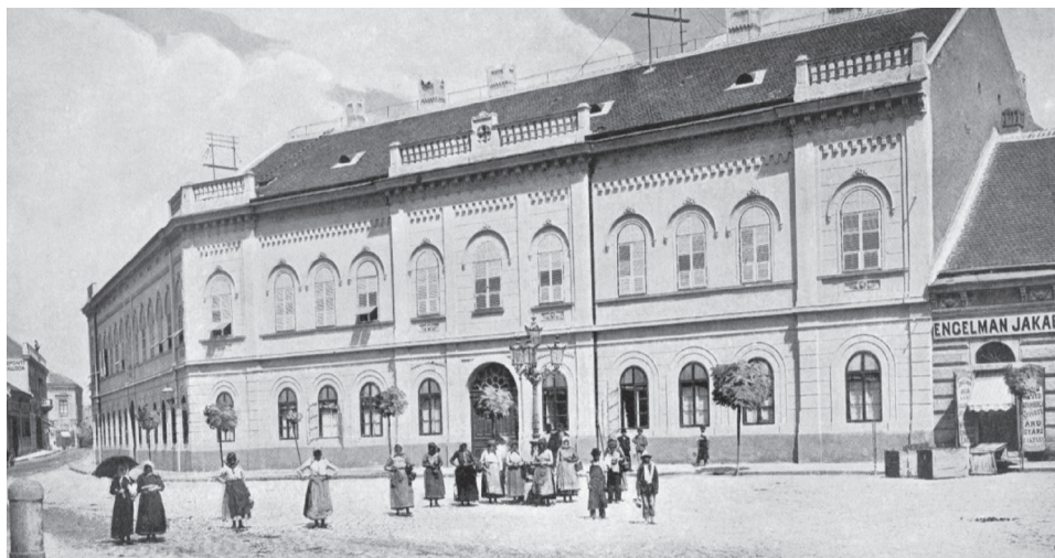
5. sz. ábra. A ciszter (zirci) rendház előtte a különleges négy karú lámpaoszloppal (Emlékkönyv, melyet Magyarország ezeréves fennállásának ünnepén közrebocsát a hazai ciszterci rend, 1896.)

Az 1886-os jegyzéken már csak egy iparos neve szerepel („Zerl pék sarok”), ami a korábbi jegyzékek „Scheidl pék” nevével azonosítható. A kereskedőkkel hasonló a helyzet, mint az 1877-es jegyzéken, ám két boltot neveztek meg (Krsztanics bolt, Neuvirth féle üzlet). A középületek közül újonnan jelenik meg az árvaház telek, az iskolaépület, a postamester és a takarékpénztár (bár ez utóbbi mint prészház már szerepelt az 1857-es jegyzéken is). Más középületek új néven szerepelnek: Honvéd laktanya (kaszárnya helyett), preparandia (korábban képezde). A felsoroltakon kívül még hat középület található a jegyzékben (Járásbíróóság, kaszárnya, Kórház, Méntelep, mérték hitelesítő, városháza). Az egyesületek közül csak a „Fogyasztó egyesület” szerepel, amelynek a belvárosban saját háza volt. Vendéglők, szállodák közül csak három szerepel: Bárány, Fehérhajó és Nemzeti szálloda.