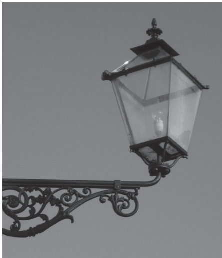
7. sz. ábra. Az egyik megmaradt gázlámpa villanyra átszerelve egy Tóth Kálmán utcai magánházon

„Nem kell fejtegetni az utczai kivilágítás üdvös voltat a közbiztonság tekintetéből; csak arról lehet szó, hogy vajjon városunk utcáin a felállított lámpák eléggé célszerűen, 's az egyes város részek és utcák igényeihez beosztattak-e. Ugyan is nálunk legkevesebb gond fordítatott némely nagyobb forgalmú 's a központtól távolabb eső utcák kivilágítására.” 54