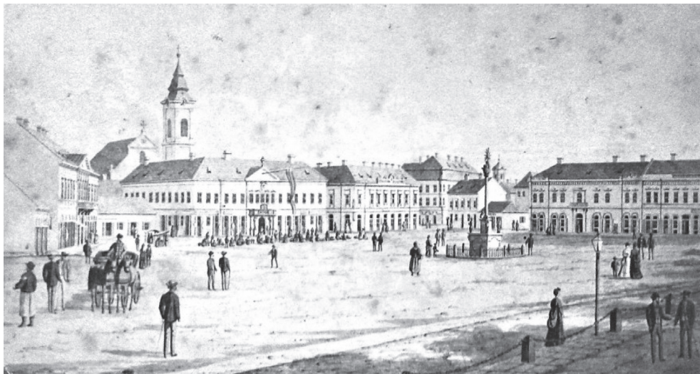
2. sz. ábra. Baja főtere 1872-ben

rendelkezünk, feltehetőleg a kövezett utcákban volt világítás, mivel ezek voltak a város előkelő utcái. Ezen kívül a városi tanács meghatározó embereinek, valamint a város kiemelkedő polgárainak házai előtt is állhattak lámpák, hiszen ebben az időben egyfajta rangot jelzett, ha valakinek a háza előtt lámpa állt. Bajának 1833 előtt is volt olyan utcája, amelyet világítottak, erre utal például a Lámpa utca elnevezése is. Az első időszak 1833 májusától több mint egy évig tartott, amikor a polgárok által összegyűjtött pénz elfogyott. Két évvel később már a városi pénztárból fizették a vállalkozókat, a lámpagyűjtőket és az olajat. A város történetének egyik legnagyobb katasztrófája, az 1840-ben bekövetkezett „nagy tűz” után az utcák éjszakai világítását megszüntették, és csak az 1840-es évek végén kezdték újra, ekkor azonban az 1848–49-es forradalom és szabadságharc szolt közbe, így folyamatos közvilágításról csak 1854–55 telétől beszélhetünk, amikor a polgármester indítványára a város díszítése és a közbátorság emelése érdekében ismét világítani kezdték az utcákat. 1863-ban a kőolajvilágítás bevezetésére szerződést kötöttek, majd 23 évvel később sikerült egy gázvilágítási vállalkozóval több sikertelen próbálkozás után szerződést kötni, s ennek eredményeként 1887. február 9-től már gázlámpák világították az utcákat.