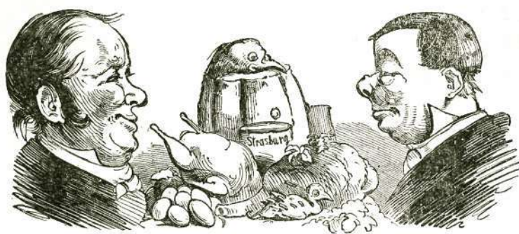
A mai német tudomány materialistikus iránya,