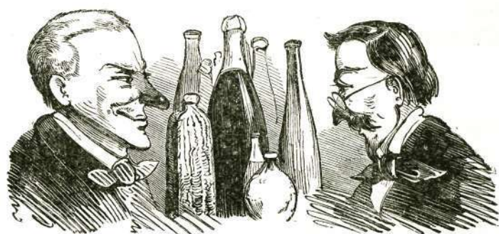
A francia spiritualismus, —