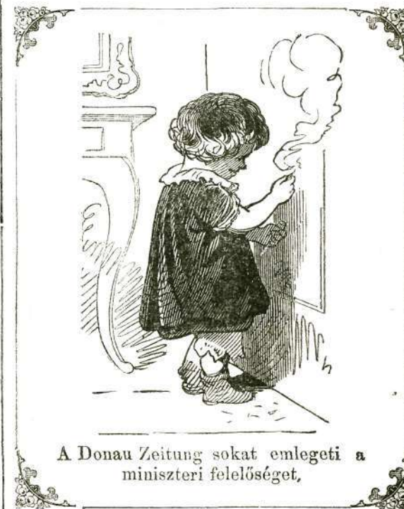
A Donau Zeitung sokat emlegeti a miniszteri felelőséget,

Pozsonyban egy gyermek jött a világra, kinek mindkét lába hiányzik. Nagy baj szegényre, hogy nem Poroszországban született, ott Bismark miniszterelnök urtól megtanulhatna — a más lábán járni. — Más lenne az eset, ha fej nélkül született volna; fej nélkül boldogulni a mi birodalmunkban is megtanulhatott volna.