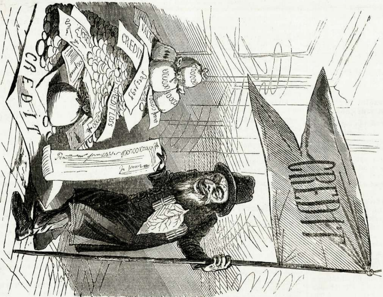
Vitéze és fegyverei.