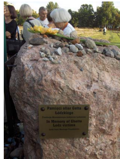
En la juda tombejo de Lodzo