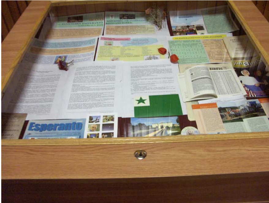
Fotis László Pásztor