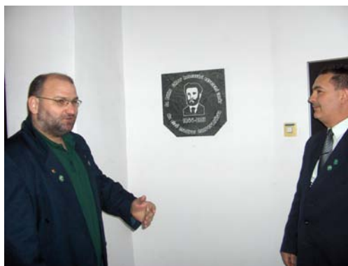
Emléktábla avatás Egerben