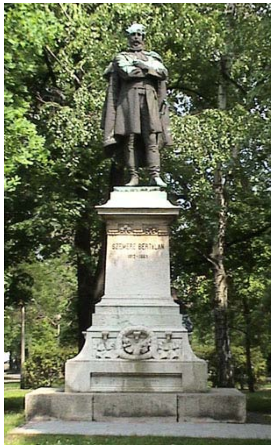
Miskolc - Szemere szobor