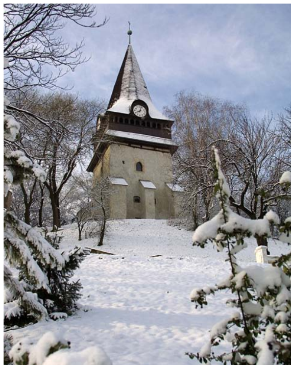
Az Avasi Református Templom Harangtornya