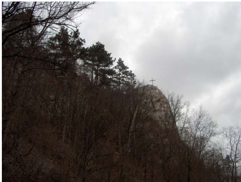
A Molnár Szikla

Ekkor kapta a fehér szikla a Molnár Szikla nevet.