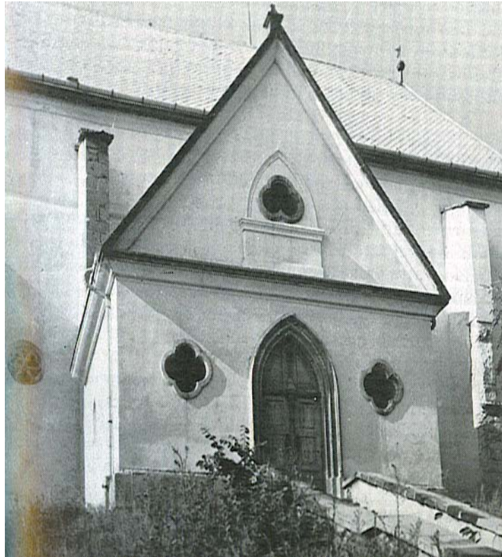
A barna palával fedett templom helyreállított cinterme 1919-ben.

A városi évkönyv 1597. július 1.-i bejegyzésében a templom palánkkal való bekerítéséről is olvasunk. Szokás volt ugyanis a török rablóportyázások, betörések idején, de még a későbbi időkben is, hogy a város lakói értékeiket, élelmüket: búzájukat és szalonnájukat legjobban megerősített helyre, az avasi nagytemplomba, ládákban, biztonságba helyezték. A biztonságosabb őrzés céljából ebben az esztendőben is erős palánkkal vették körül az egész templomot.