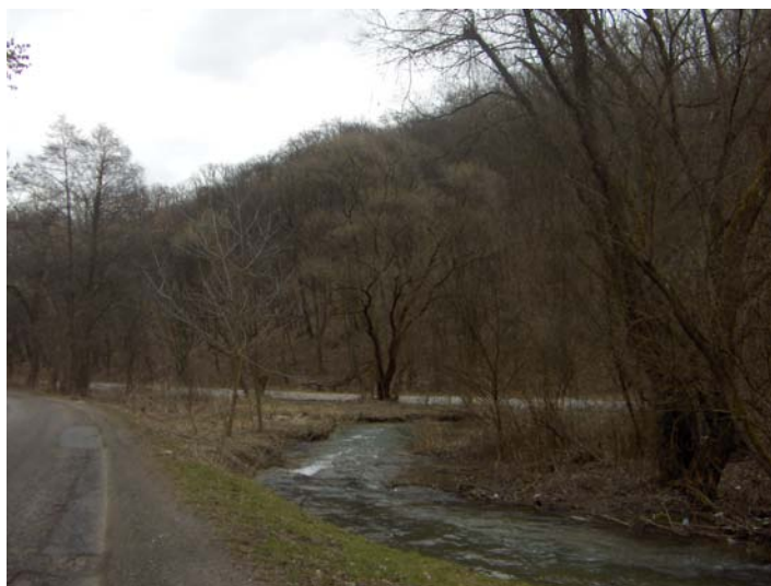
A Molnár Szikla környéke márciusban

A víz lemosta a halott összekaszabolt arcáról a porlepte verejtékekkel együtt a vadgyümölcsök rászáradt levét és húsát. A jobbágy nép, az elhúnyt lelkeüdvéért porbahullva imádkozás közben megállapíthatta, hogy ez az ember nem volt leprás. A közben hazaért és odaérkezett fivére pedig elmondta, hogy fitestvére olyan vitéz, olyan hős volt, mely nem termett az addigi évszázadok alatt magyar földön a jobbágyok között soha. Sajnos megölte őt az emberi ostobaság, áldotatul esett az átkos vakbuzgóságnak.