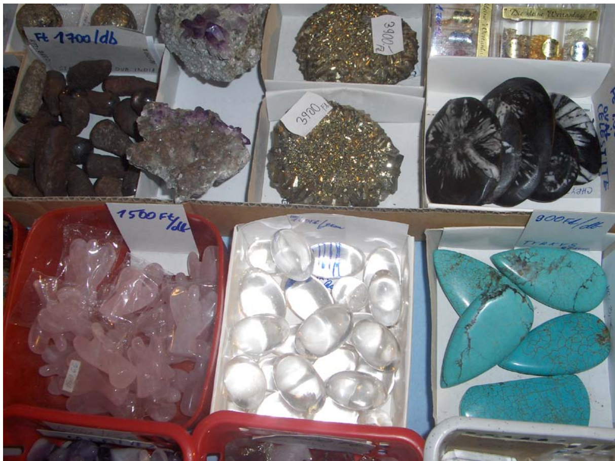
Csiszolt és csiszolatlan ásványok a Miskolci Ásványfesztiválon