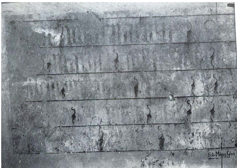
Az északi falon talált felirat

Az értelmezhető rész Klein Gáspár fordításában: „Az Ige megtestesülésének 1489. esztendejében Mars / ? / napján, kedden, ezen a helyen...”