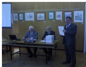
Proponatas legi la tradukaĵo