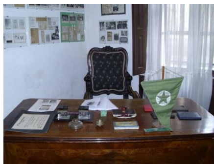
Detaloj de la ĉambro Kalocsay

La dua fazo de la festo okazis ĉe la busto de nia granda sampatrujano. Tie ni povis sperti, ke la regule nian lingvon nelernantaj ok jaraj infanoj kiel bele, lerte prezentis dulingve versaĵajn fabelojn esperantigitajn de d-ro Kalocsay.