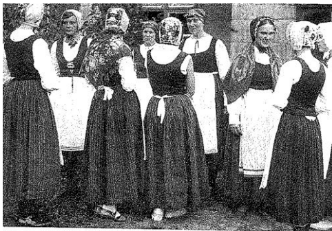
Liv asszonyok nemzeti viseletben

la Livonoj asimiliĝis al la du popoloj. En la 13. jarcento ankoraŭ 30 miloj da homoj parolis la livonan lingvon, sed fine de la 19a jarcento, nur du mil. Kaj la Latva organizaĵo vane organizis la instruon de la Livona lingvo en la 20-a jarcento, ja de 2009 jam nek unu homo konfesas sin Livano, neniun parolas jam la Livonan lingvon en Latvio, aŭ en Estonio kontraŭ tio, ke en Tartu kadre de la Universitato funkcias ankaŭ Fakultato pri Livonoj. En Universitato de Tartu, la 23an de novembro 2011. okazis rememora prelego pri la Livona popolo kaj kulturo.”