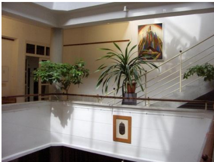
Hatvan - Ady Endre könyvtár

Az eszperantó nyelv 125. éves évfordulója alkalmából közöljük Baghy Gyula szép versét Pál István fordításában.