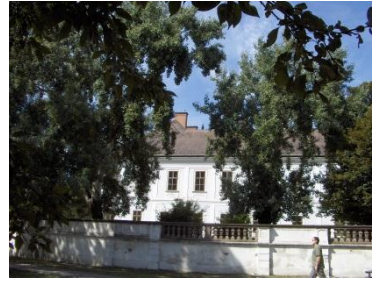
Hatvan – Grassalkovich kastély