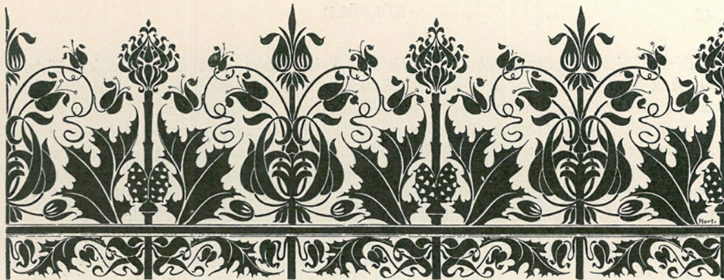
SZALAGDISZÍTMÉNY. Tervezte Horti Pál.