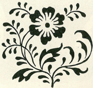
RÉSZLET MAGYAR KARTONNYOMÁSRÓL. (XVIII. század.)