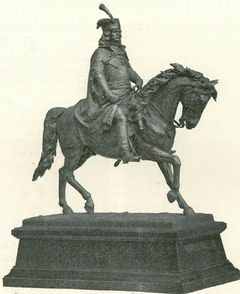
II. RÁKÓCZY FERENC. Vasadi Ferentől.