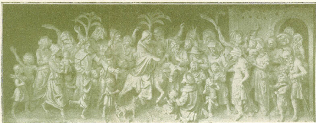
KRISZTUS BEVONULÁSA JERUZSÁLEMBE. Domború mű a bártfai főoltáron.