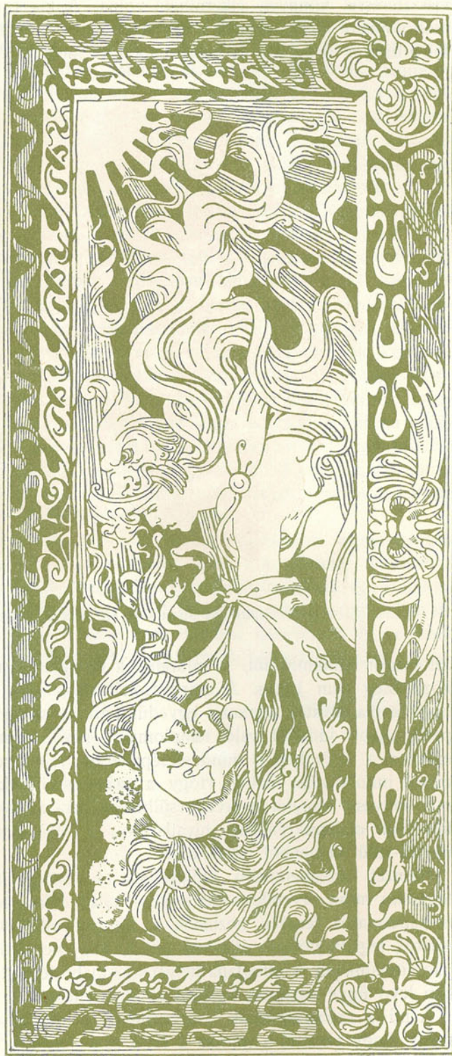
Szentély- Arpád rajza.

A Hölzel Mór mintázta domborúművek közül leg szebb a Krisztus bevonulása Jeruzsálembe, mely kompozíciójával, alakjainak finom megmintázásával, a régi bártfai faragványok legszebb példáira emlékeztet. E mű azonban oly magasra került, hogy a keretéül szolgáló faragott árkádjainak oszlopocskáitól amúgy is többszörösen megszakítva alig érvényesül. A modern faragásnak gyakori hibája, hogy a térbeli hatásról az aprólékos részletezés elvonja figyelmét, a mi a szárnyas oltárok egyszerűbb szerkezetéhez való