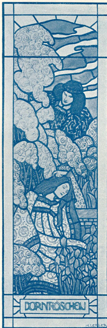
A „Kunst u. Kunsthandwerk“-ből. ÜVEGMOZAIK.

Az iparművészeti múzeumokat idáig történelmi alapokon szervezték s a már fennálló formák továbbfejlesztésével nem gondoltak;