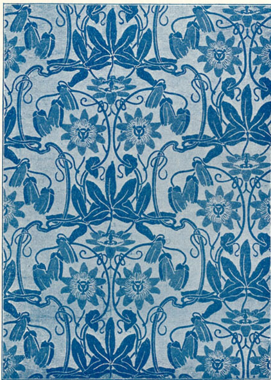
A „Kunst u. Kunsthandw.“-ből. TAPÉTA.

E század második felében lépett föl egy nevezetes művészettörténeti sajtóság. A keletázsiai művészet, miként azt kiváló tudósok kutatásai révén megtudtuk, éppen úgy, mint a nyugati művészet is, a görög műbefolyás