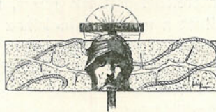
Hegedűs L. rajza.

Kunstpflege im Dienste des Heims von M. J. Gradl und C. Schlotke. Alexander Koch kiadása Darmstadtban. Ára 32 márka. Első sorban dilettánsok számára készült, de jól használhatják a tartalmas munkát iparosok és ipariskolák is. Jobbára a lakás díszítésénél alkalmazható s részben színesen sokszorosított minták nagy sokaságát tárja elének az a húsz lap, a melyből a kiadók engedelmével több szemelvényt közlünk a jelen füzetünkben. Ezekből látható, hogy két oly művész munkájával van dolgunk, a kik a modern irányzattal számolva, ügyesen stilizálják a természetből vett formákat a különböző anyagokhoz. E munkában a modern stilusnak egyik válfaját, a németet, látjuk kifejeződni. Ez is dicséretére válik a szerzőknek, a kik angol nyomon indultak ugyan, de e mellett érvényesíteni tudták nemzetük ízlését.