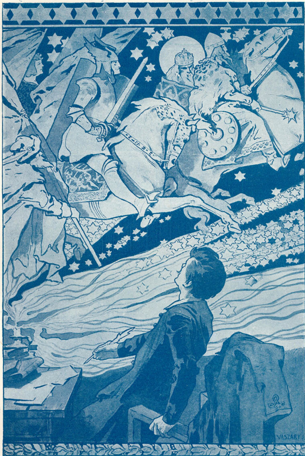
Vaszary János rajza.