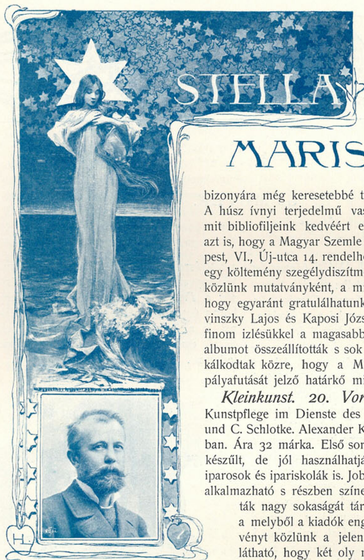
Hegedűs L. rajza.