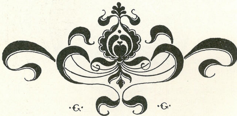
Györgyi G. rajza.