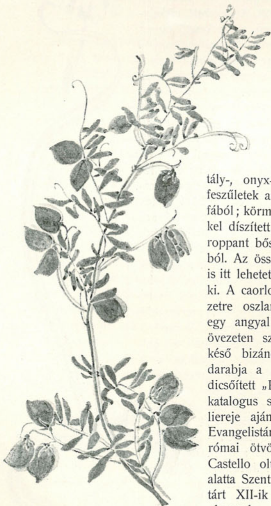
Beniczky M. rajza.

Csodálatos alakú ereklyetartók masszív-aranyból vagy drágakővel berakottak; kristály-, onyx-, chalcedon kelyhek; arany szentségtartók; feszületek aranyból, ezüstből, elefántcsontból vagy ébenfából; körmeneti zászlók, misemondó ruhák, becses képekkel díszített miséskönyvek stb., szóval az egyházi kincsek roppant bősége, részben a világhírű Tesoro di San Marco-ból. Az összes darabok beható méltatása, sőt csak említése is itt lehetetlen. Csak a legnevezetesebbekre terjeszkedünk ki. A caorloi dóm oltárjának (pala d'oro) figurái két övezetre oszlanak. A felsőben Krisztus a trónon, mellette egy angyal teljes alakban és Mária mellképe; az alsó övezeten szentek állva, a keretben szentek mellszobrai, késő bizánci stíl. Az egész gyűjtemény legbecsesebb darabja a velencei korai renaissance annyi mesterétől dicsőített „Reliquie della vera Croce“. E szent reliquiát a katalogus szerint Meizières Fillipo, Ciprus gran-cancelliereje ajándékozta 1369-ben a Scuola di S. Giovanni Evangelistának. Még csak egy XIV. vagy XV. századbéli római ötvösmunkát említünk, a velencei S. Pietro di Castello oltárát a trónoló Arisztussal a 12 apostol közt, alatta Szent Péter tizenkét más szenttől körülvéve. Ez oltárt XII-ik Gergely pápa ajándékozta a nevezett templomnak.