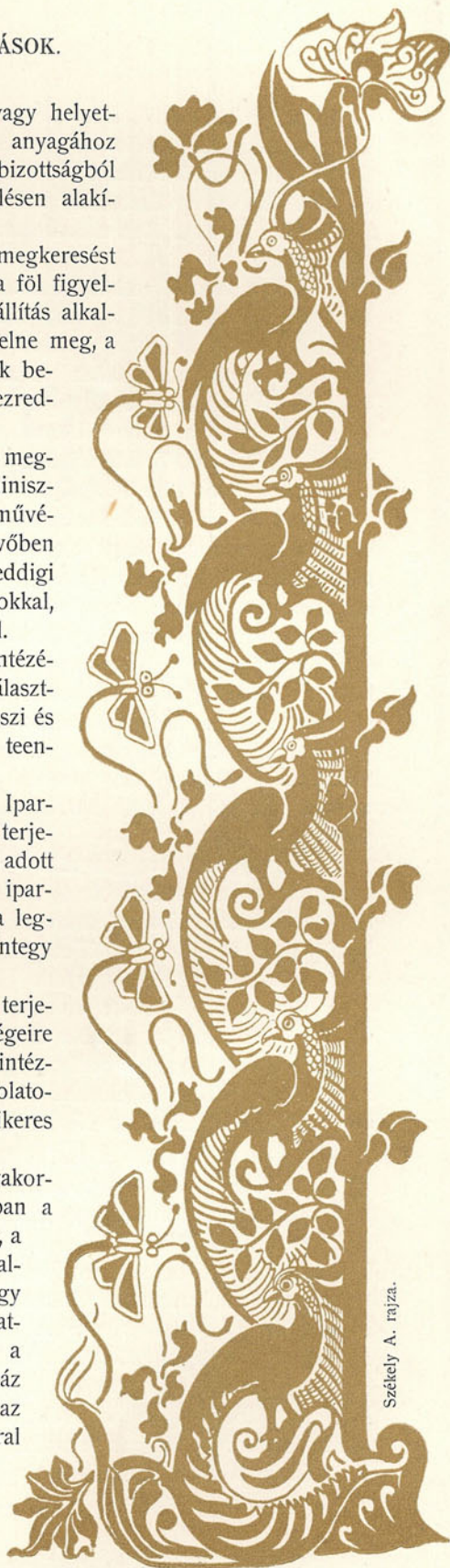
Székely A. rajza.

Miután pedig immár nyilvánvaló, hogy a lap gyakorlati irányánál fogva jó szolgálatot tehet mindazokban a tanintézetekben, a melyeknél a rajzolás kötelező tárgy, a választmány elhatározza, hogy felterjesztést intéz a vallás- és közoktatásügyi miniszterhez oly célból, hogy az a lapot a főhatósága alatt álló tanintézeteknek hathatósan ajánlja. Egyben elhatározza azt is, hogy a most megjelenő VI. és VII. kettős számból kétszáz feles példányt nyomtat, a melyet mutatóványszámként az illető tanintézeteknek és ezen felül a művészi iparral foglalkozó ipartestületeknek stb. meg fog küldetni.