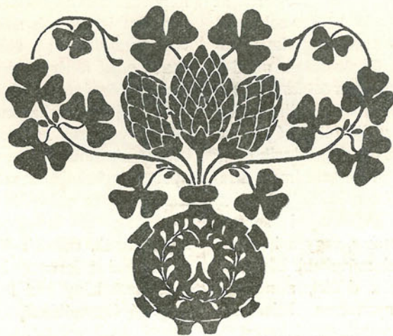
Beniczky Margit rajza.