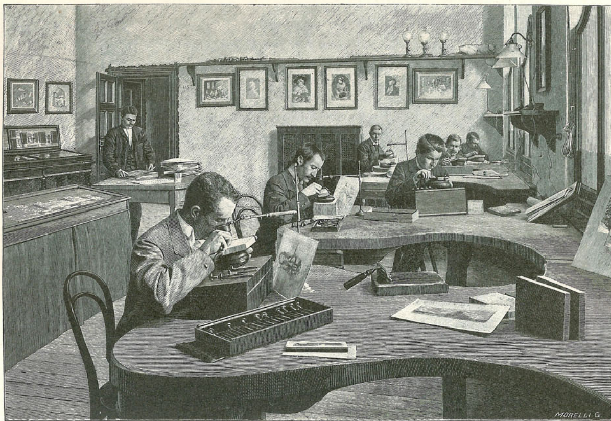
AZ IPARMŰVÉSZETI ISKOLA FAMETSZŐ-OSZTÁLYÁNAK EGYIK TERME.