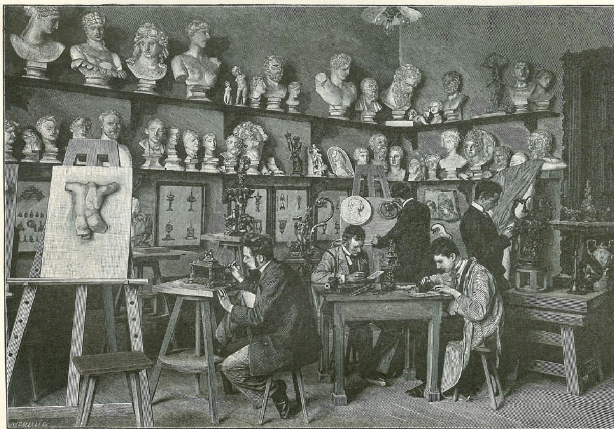
AZ IPARMŰVÉSZETI ISKOLA KIS PLASZTIKAI SZAKOSZTÁLYÁNAK RÉSZLETE.