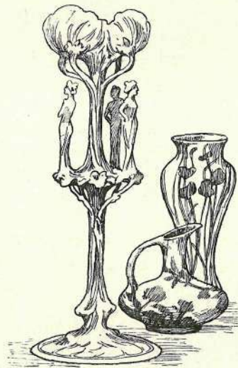
DÍSZEDÉNYEK A PÁRISI SZALONBÓL.

vezetés nélkül hiába való s művészi szempontból értéktelen az olasz műipar működése. Olaszország művészei is jól érzik ezt s ez év tavaszán egyesületet alakítottak, a melynek céljául képzőművészetük ügyének modern szellemben való ápolását tűzték ki, figyelmüket az iparművészetre is kiterjesztvén. Bizonyára évek fognak még elmulni, a míg fáradozásuk sikere esetén az olasz iparművészet a modern művészet szempontjából jelentősebb szerephez jut.