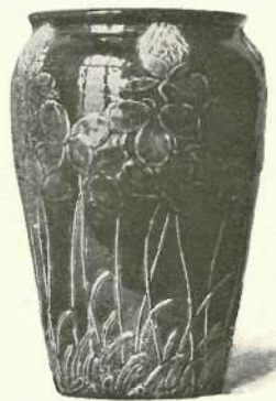
FAJENCE-VÁZÁK ○○○○○○ ○○○○○○○ A TEPLITZI AGYAGIPARISKOLÁBÓL.