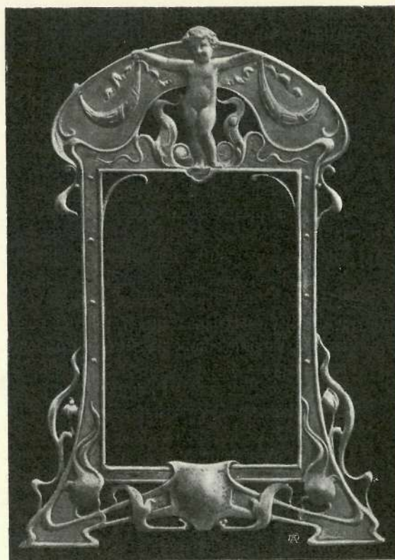
SPICER-SIMSON I. ••• LONDON. ••• EZÜST KÉZI TÜKÖR •ÉS KÉPKERETEK. •