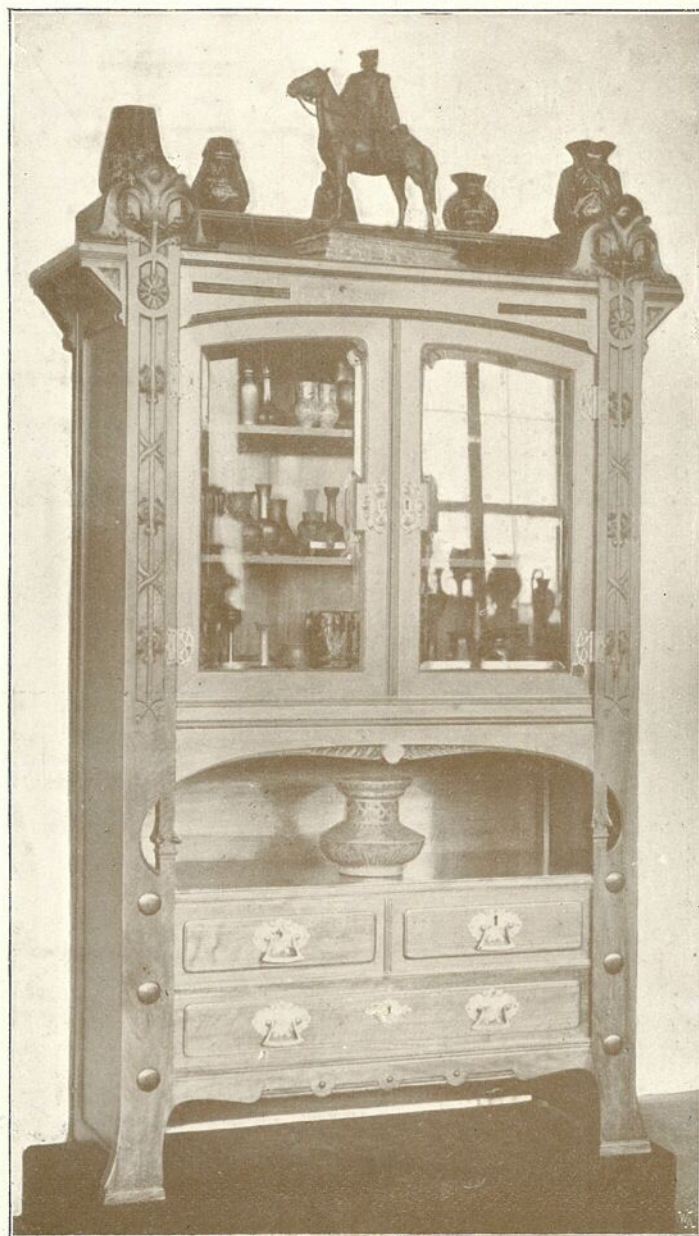
SZALONSZEKRÉNY. TERVEZTE FARAGÓ ÖDÖN. KÉSZÍTETTE ZWICKL ADOLF. SZEGED.