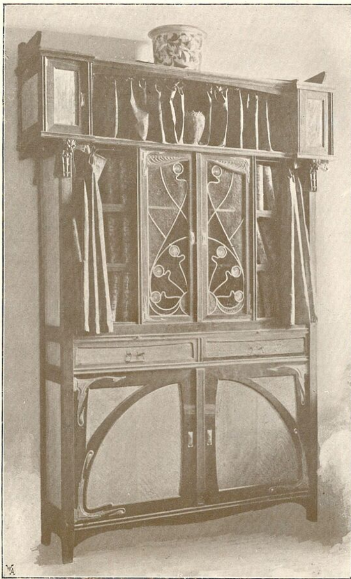
KÖNYVSZEKRÉNY. TERVEZTE IFJ. RAINER KÁROLY. KÉSZÍTETTE RAINER KÁROLY. SZEGED.