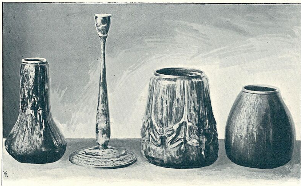
RAPOPORT-FÉLE ZOMÁNCOS MUNKÁK. KIÁLLÍTJA A „MAISON MODERNE“ BUDAPEST.