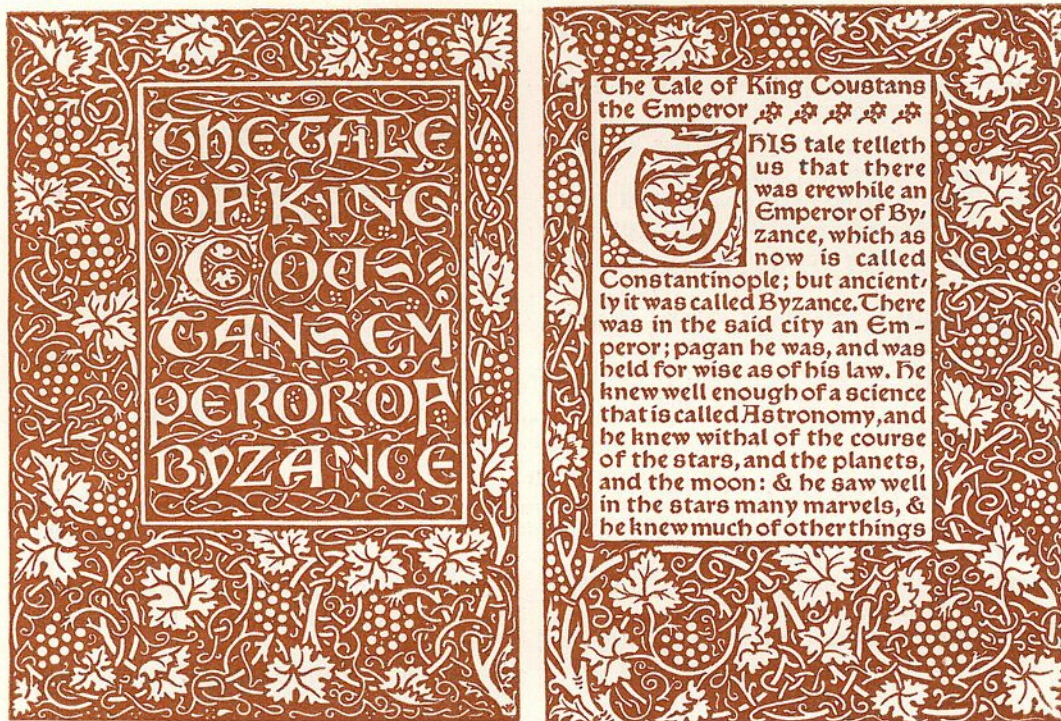
SZEMELVÉNY CZAKÓ E. KÖNYVNYOMTATÁS ÉS KÖNYVDISZÍTÉS IPARMŰVÉSZETE C. MŰVÉBŐL: WILLIAM MORRIS. KÖNYVDISZ.