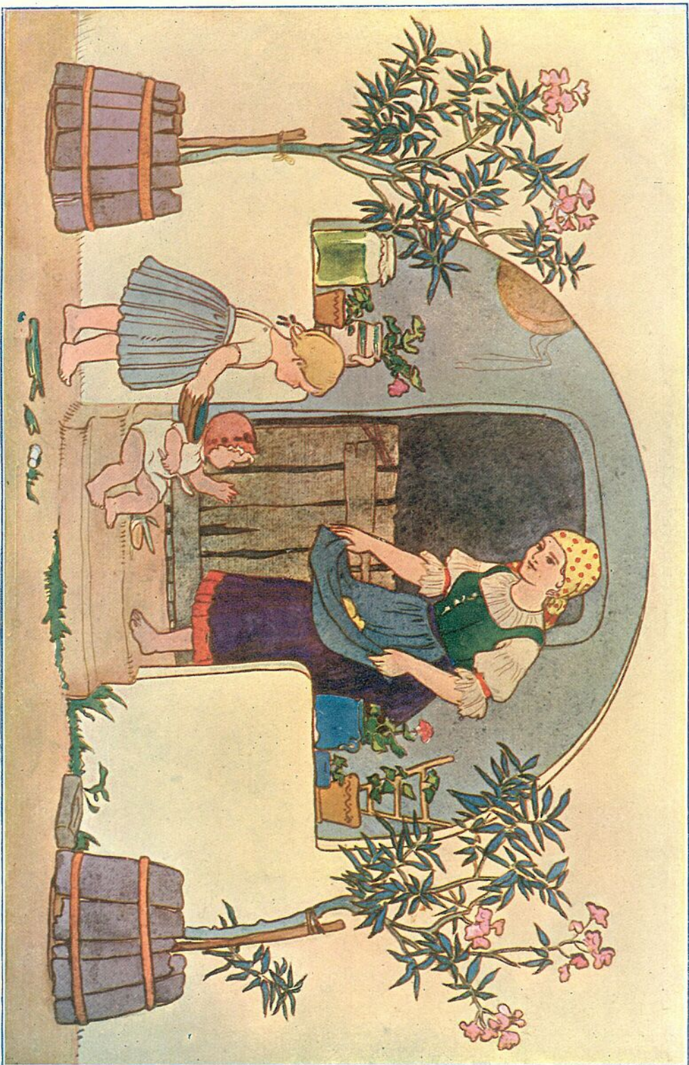
SOMOGYI PARASZTHÁZ PÍTVARA. UNDI SPRINGHOLZ MARISKA SZÍNEZETT RAJZA.