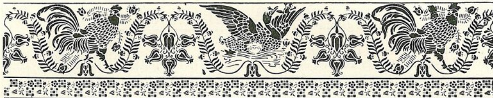
A sz. fűv. iparrajziskola kiállításából.