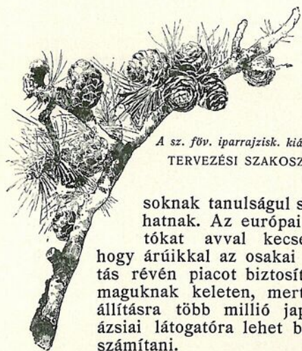
A sz. f. v. iparrajzisk. kiállításából. TERVEZÉSI SZAKOSZTÁLY.

soknak tanulsággal szolgálhatnak. Az európai kiállítókat avval kecsegtetik, hogy árúikkal az osakai kiállítás révén piacot biztosíthatnak maguknak keleten, mert a kiállításra több millió japáni és ázsiai látogatóra lehet biztosan számítani.