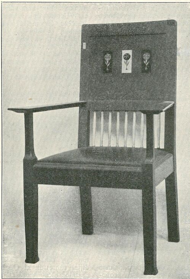
BERAKOTT MUNKÁVAL DÍSZÍTETT KAROSSZÉK.