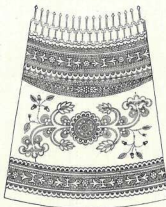
MAGYAR IVÓKÜRTÖK VÉSETT ÉKÍTMÉNYE, KITERÍTVÉ. UNG-BEREGMEGYEI KANÁSZOK MUNKÁJA.

Magyarország történelmi emlékei az ezredéves kiállításon c. műből.