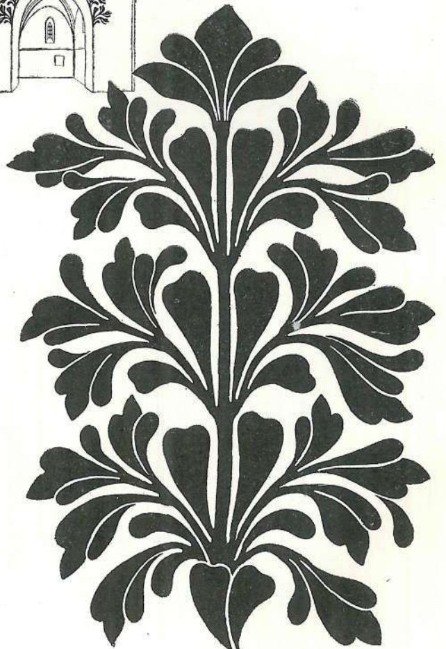
MAGYAR STÍLUSÚ RAJZMINTÁK