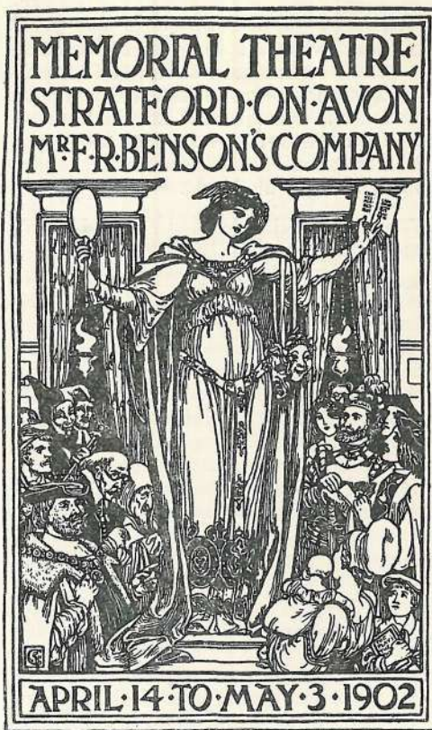
WALTER CRANE EGY CÍMLAPJA.

hogy nyomdászaink tökéletes modern felszereléssel s mindig a tökéletesre törekvő igyekezettel fognának hozzá legalább az olyan díszművek kiállításához, amelyek főcélja a jó ízlés terjesztése. A szerkesztő, kiadó és író minden fáradozását, áldozatkészségét és buzgalmát tönkreteszi az olyan nyomás, amelyet intézői csak immel-ámmal végeznek s hevenyében, semmit sem törődve azzal, hogy hanyag munkájuk megrendelőik legnemesebb törekvéseinek is kerékkötőjévé válik.