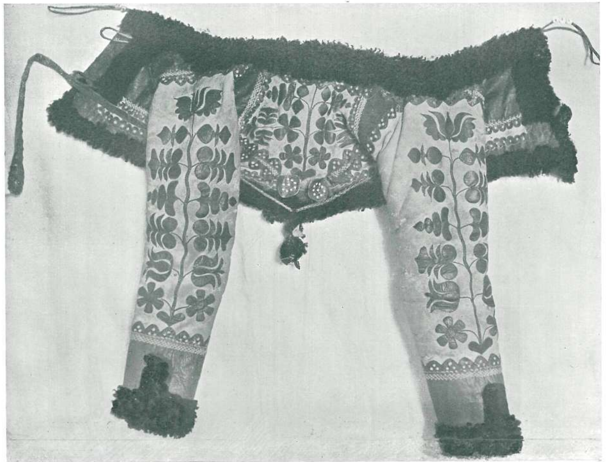
CSÖKÖLYI KŐDMEN PIROS SZATTYÁNBŐRAPPLIKÁCIÓVAL.