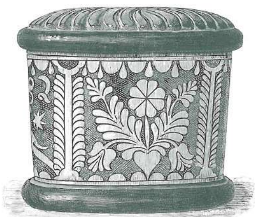
SÓTARTÓK SZARÚBÓL, PUSKAPOROZOTT DÍSSZEL, ALAPJUK SALÉTRÓMSAVVAL SÁRGÁRA MARATVA. KAPOSVÁRI IPARMŰVÉSZETI KIÁLLÍTÁS.