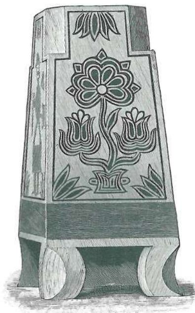
GYUFATARTÓ SOMOGYVÁRRÓL. SPANYOLOZOTT MUNKA.