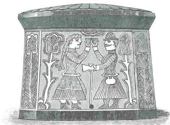
KÉSZÍTETTE ID. SÁNTHA JÓZSEF, KAPOSÚJLAKI BIVALYOS. MORELLI G. FÁMETSZETEI.