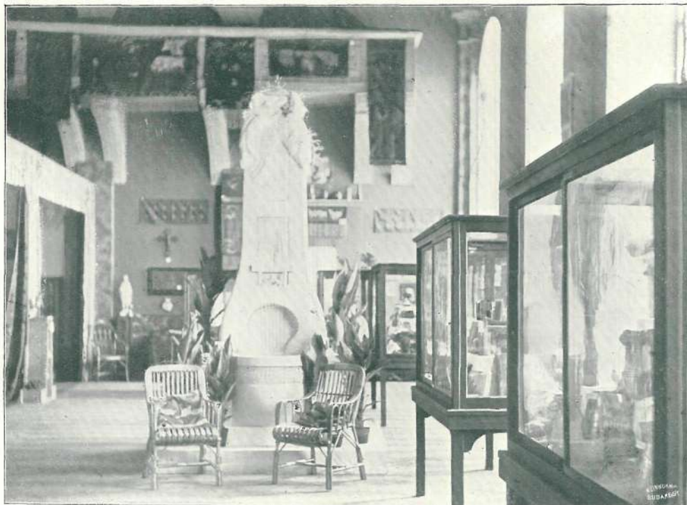
KAPOSVÁRI IPARMŰVÉSZETI KIÁLLÍTÁS RÉSZLETE.