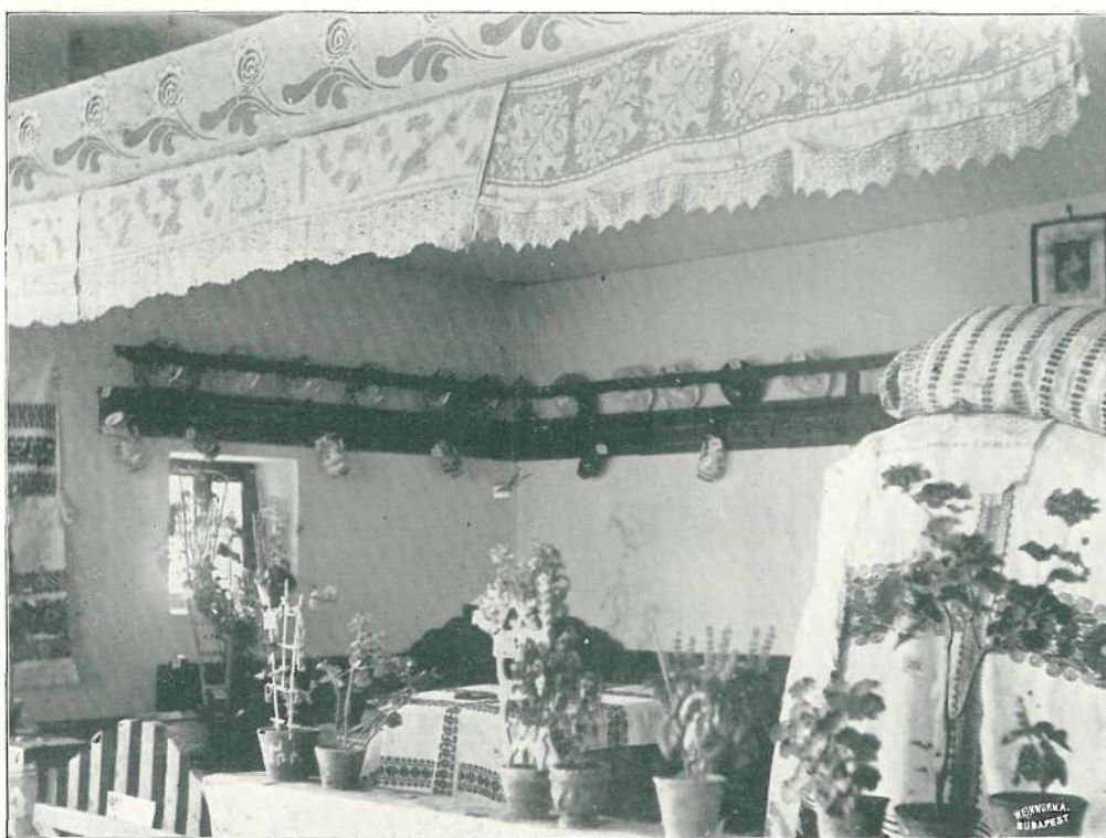
SOMOGYI PARASZTSZOBA. A KAPOSVÁRI IPARMŰVÉSZETI KIÁLLÍTÁSON.