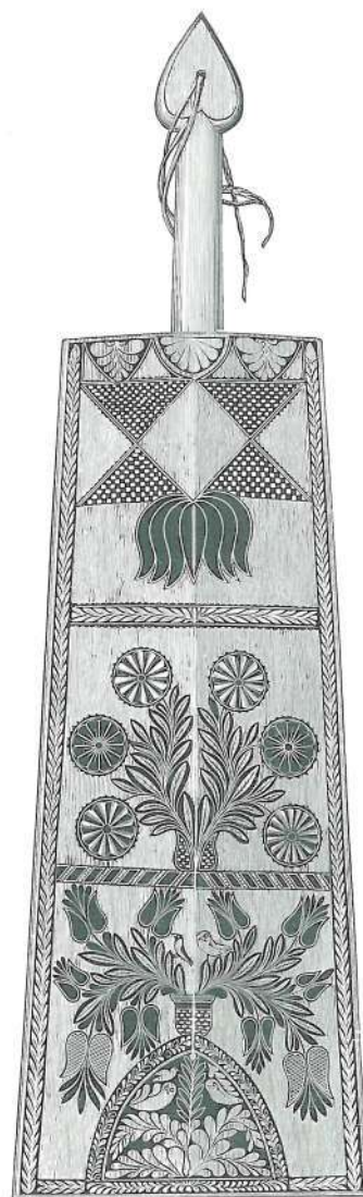
SULYOK MOCSOLÁDRÓL SPANYOLOZOTT JUHÁSZMUNKA.