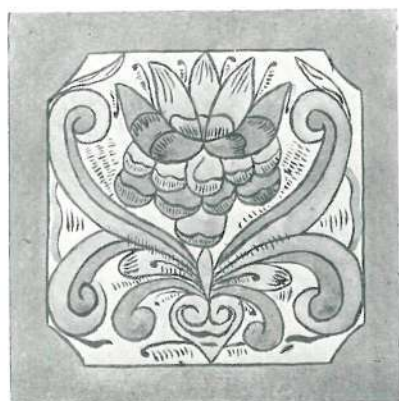
FESTETT TÁBLÁK A SZANNAI TEMPLOMBAN. KAPOSVÁRI IPARMŰVÉSZETI KIÁLLÍTÁS.