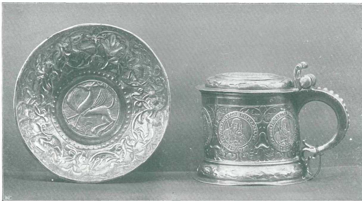
78. EZÜST CSÉSZE. XIV. SZÁZAD.

ÉRMEKKEL DÍSZÍTETT FEDELES KUPA. ARANYOZOTT EZÜST, NÉMET. XVII. SZÁZAD.