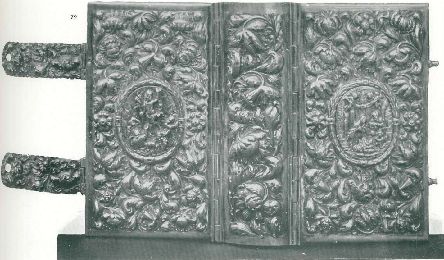
79. EZÜST KÖNYVTÁBLA. TRÉBELT MUNKA. XVIII. SZÁZAD ELEJE.