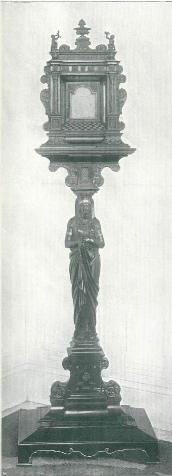
75. ÓRA, ÁLLVÁNYNYAL. ÉBENFA, BÉKATEKNŐVEL S ARANYOZOTT EZÜST DÍSZITÉSEKSEL. XVII. SZÁZAD.