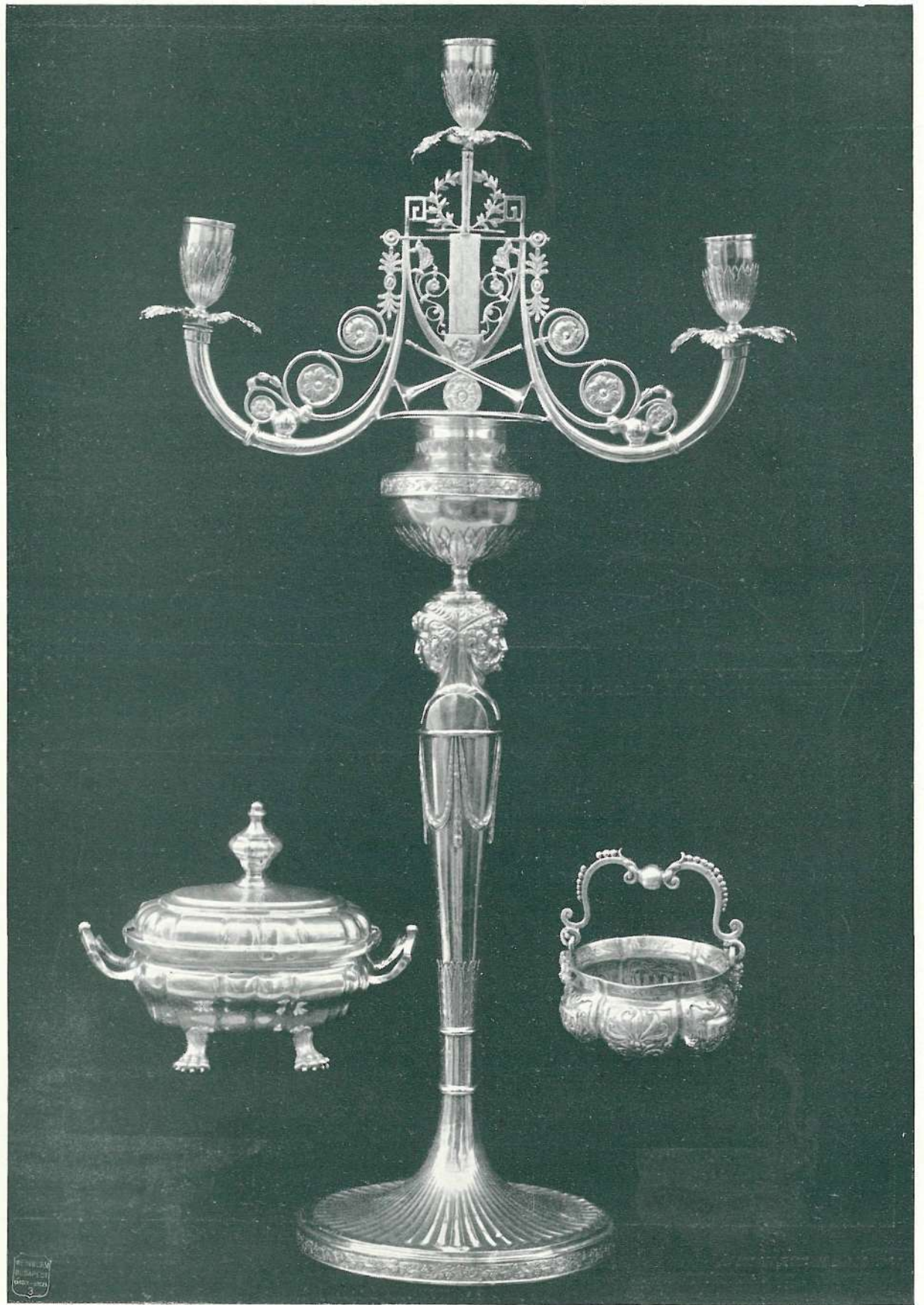
81. EZÜST LEVESES TÁL. BÉCS, 1732.