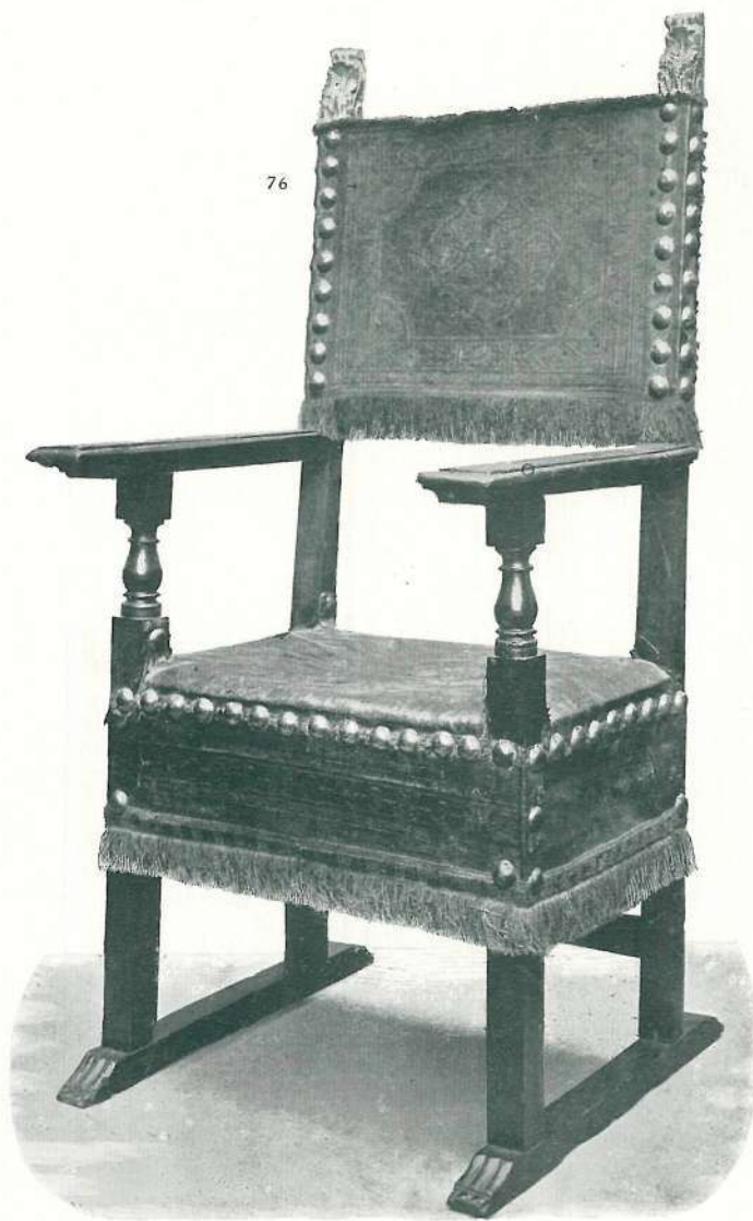
76. KAROSSZÉK. DIÓFA, HÁTÁN ÉS ÜLÉSÉN ARANYOZOTT DÍSZŰ BŐRREL. OLASZ. XVII. SZÁZAD.