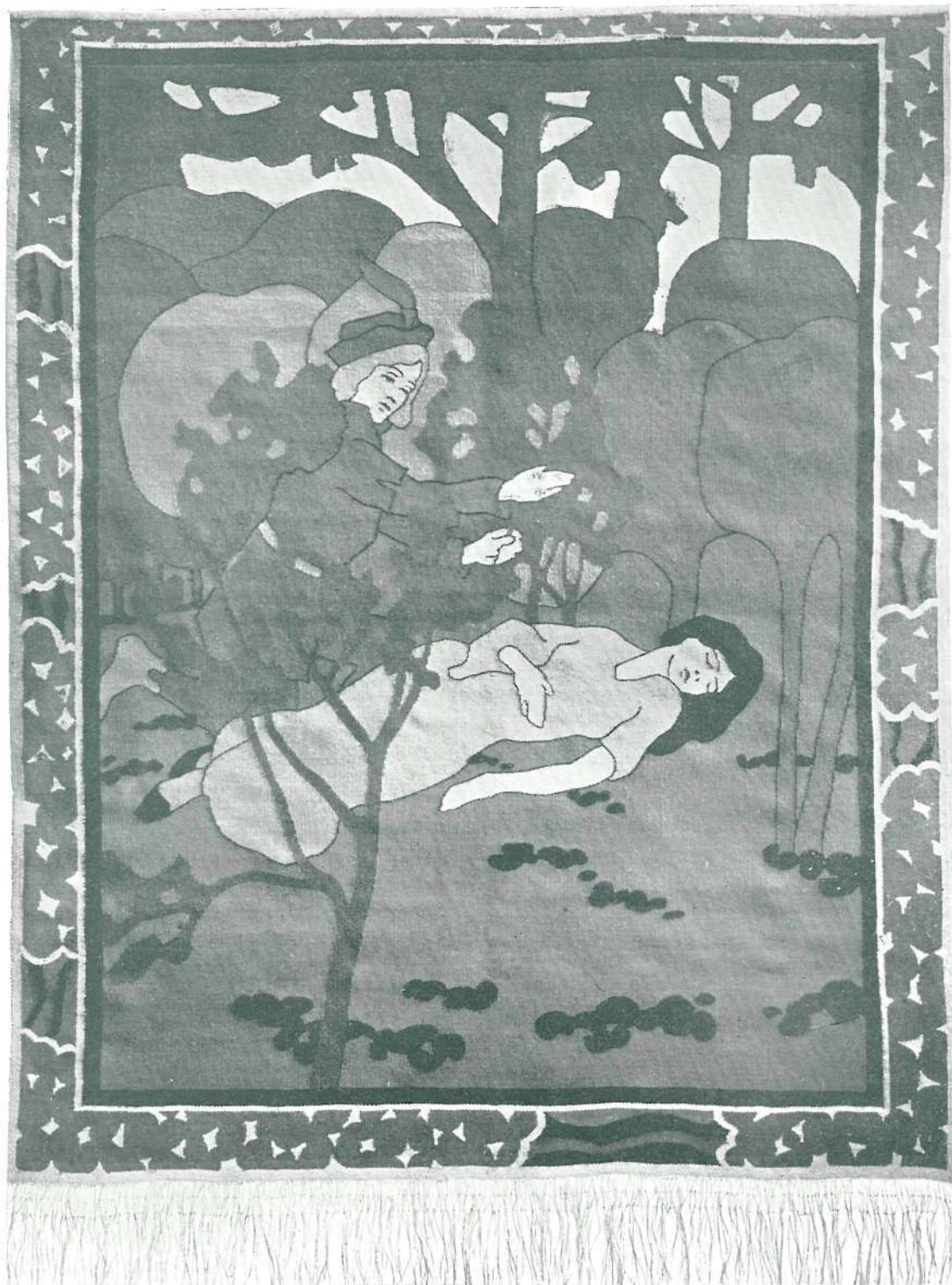
108. SZÖVÖTT FALISZÖNYEG.