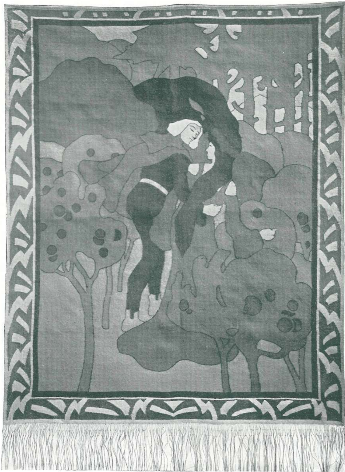
109. SZÖVÖTT FALISZÖNYEG.

TERVEZTE LAKATOS ARTUR. KÉSZÍTETTE KOVÁLSZKY SAROLTA (NÉMET ELEMÉR).