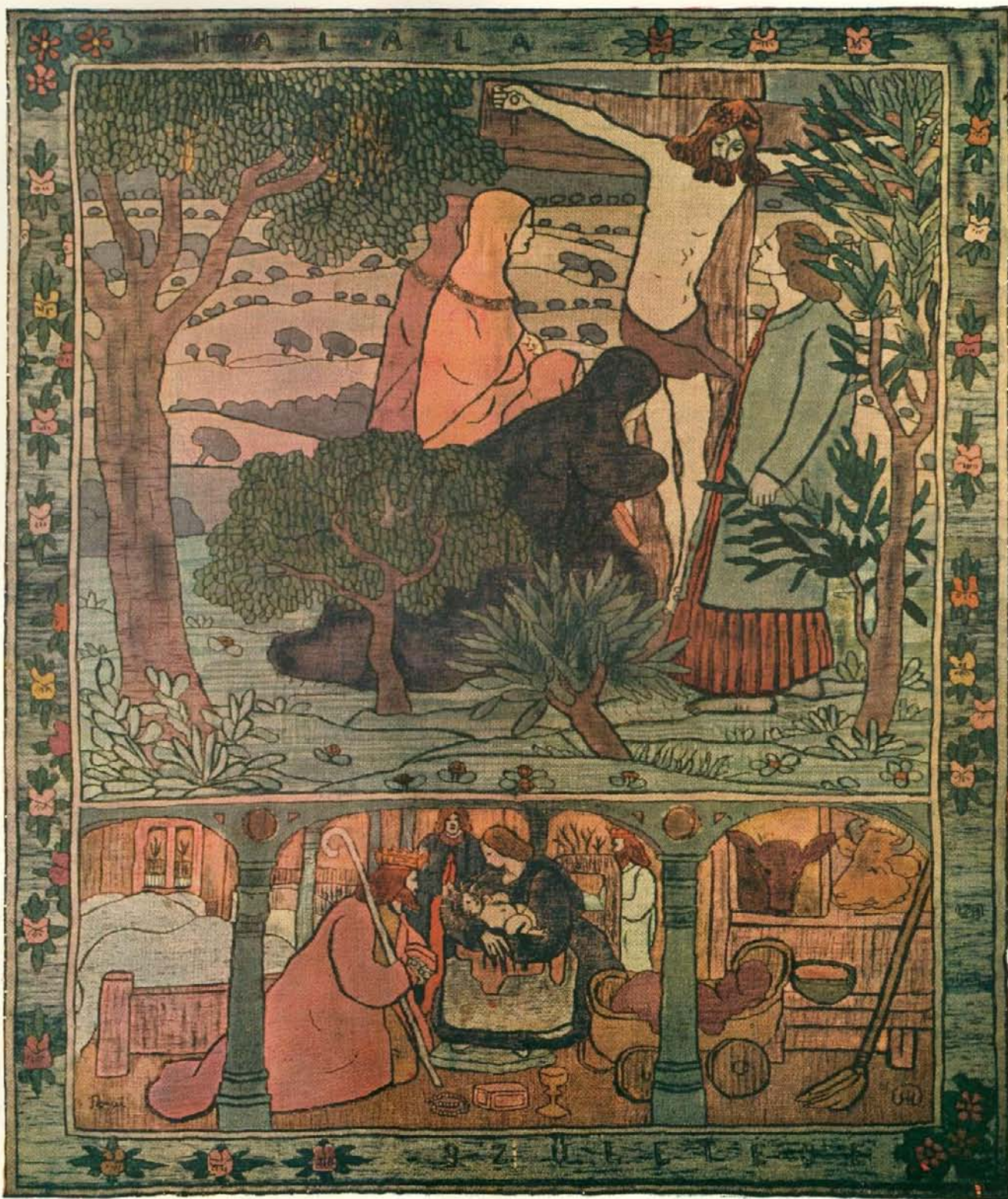
GOBELIN, RIPPL RÓNAI JÓZSEF TERVE UTÁN KÉSZÜLT A SZ. FŐVÁROSI IPARRAJZISKOLA SZÖVŐIPARI MŰHELYÉBEN.