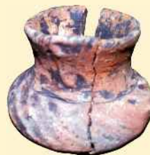
Bronzkori agyagedény (Wiettenberg-kultúra)

később a szomszéd faluk lakói gúnyolni kezdvén, hogy ott laknak az álmosok, nevét Almásra változtatta át. Ennyit tud a hadomány ezen ismeretlenül feledett romról ” (M. J. kiemelése).