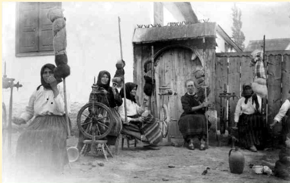
Fonás, Csíkszenttamás (Hargita megye). Vámszer Géza felvétele, 1933 Kriza János Néprajzi Társaság fotóarchívuma. Jelzet: KJNT_11609

A székelyföldi kaláka eredete is a faluközösségek, a közösségek idejére nyúlik vissza. A gazdálkodást itt sokáig a nagycsaládi termelés jellemezte, a munkaerő elosztását családon belül biztosították, a munkamegosztás is ilyen keretek között zajlott. A nagycsalád birtokolta a termelőeszközöket és a földet, és az általa biztosított munkapotenciál elégséges volt a gazdaságban előálló feladatok ellátására. A termelés patriarchális kereteinek, az ilyen jellegű ellenőrzésnek a felbomlásával meg-