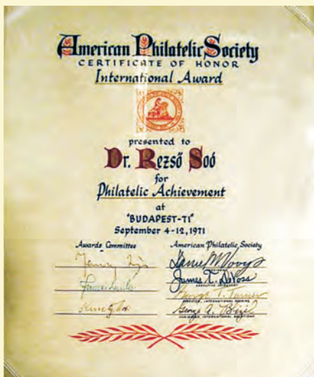
Az American Philatelic Society által 1971-ben kiállított oklevél Soó Rezső részére

Kolozsváron, az «iskola» egykori második központjában is tovább éltek a hagyományok; a múlt század második felében a Soó-iskolát közvetlenül Csűrös István, Nyárády Erazmus Gyula, valamint Nyárády Antal személye és munkássága képviselte, később körük csoportosult, vagy velük kapcsolatban levő botanikai műhelyekben dolgozott számos további «közvetett» munkatárs és tanítvány, kelet felé gazdagítva a magyar botanika művelőinek körét.” „Ezt az iskolát nagyon komolyan vette Bukarest, Iași, Craiova és minden más romániai város. Számptalan témát még Soó Rezső vetett fel követőinek, és amikor ők kerültek vezető helyzetbe, akkor azok adták tovább tanítványaiknak, és így érett meg tulajdonképpen a harmadik német vagy román anyanyelvű diáknemzedékben több monográfiai kötet.”