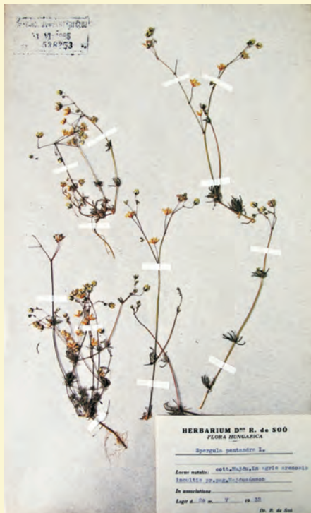
Soó Rezső herbariumi hagyatékának egy darabja (homoki csibehúr) a kolozsvári Babeş–Bolyai Egyetem Botanikus Kertjének gyűjteményében.

(Lásd http://www.vasiszemle.t-online.hu/2003/04/kovacs.htm .)