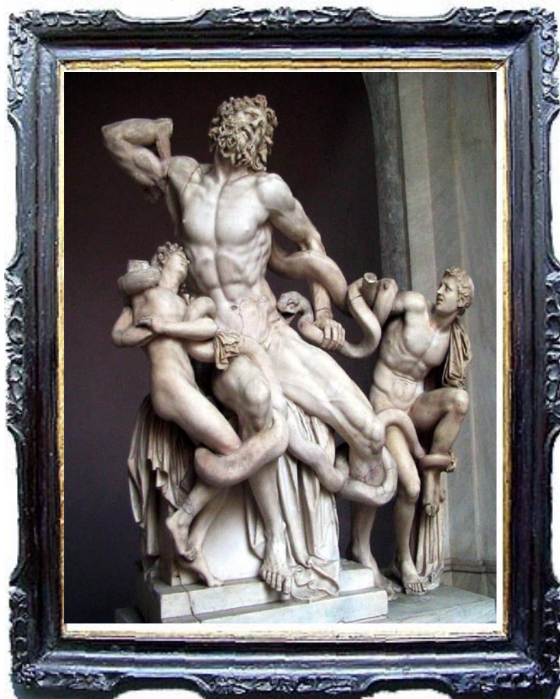
rodoszi Hagészandrosz, Athénodórosz és Polüdórosz Laokoón-csoport, Kr. e. 175-150 (?), Vatikáni Múzeumok