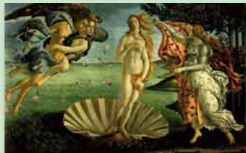
Sandro Botticelli, Vénusz születése, 1483-85 k. Firenze, Uffizi

E gyönyörű nőket gyakorta sújtó betegség a tizenéves Mónikát is elkapta: sajnos immár több mint egy éve ő is szemérmességben szenved.