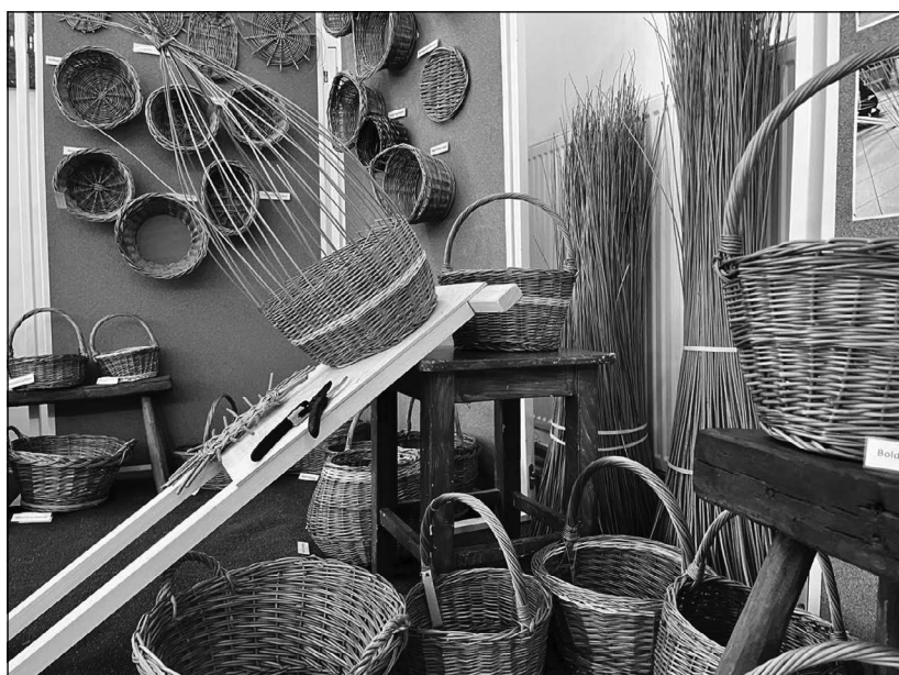
Vesszőfonás sarok a kiállításon

díszítettek. A kezdeti nehézségek után – mikor már kitapasztaltuk, mennyi idő után sült meg szépen a tésztánk, milyen a megfelelő álagú cukormáz, hogyan is fogjuk az írókát, hogy egységes vonalakat tudjunk varázsolni díszítés gyanánt – egymástól is sokat tanultak a tagok, hiszen előkerültek az idősebbek saját „jól bevált” receptjei az otthoni fiókokból, és korábbi