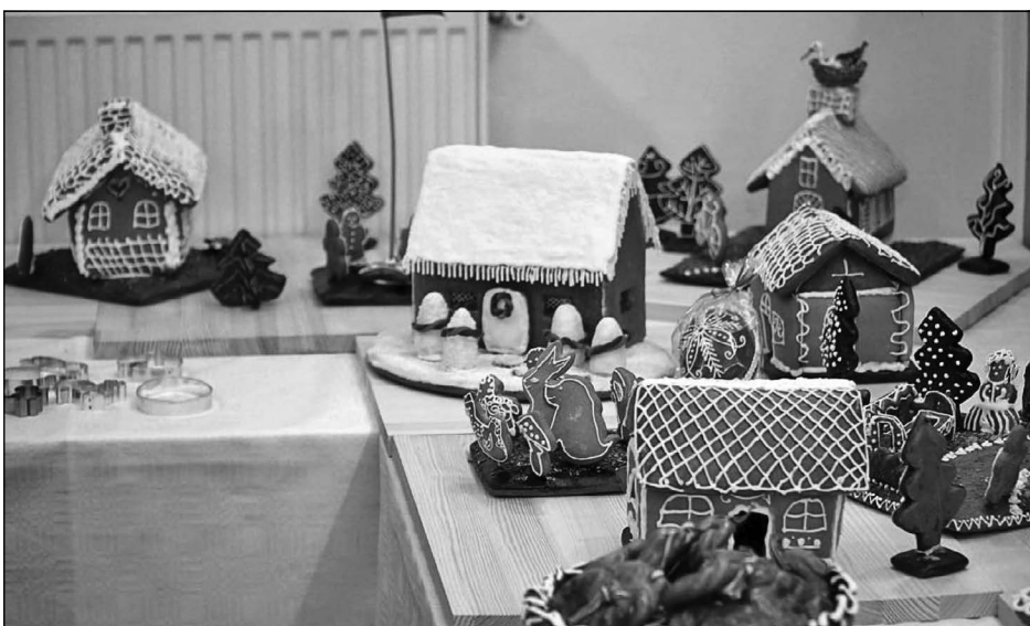
A város épületei mézeskalácsból a kiállításon

A mézeskalács készítése komoly hagyományokkal rendelkezik, s a foglalkozások alatt mi is rádöbbentünk, hogy ez több, mint egy sütemény. Miközben a videók segítségével köszönhetően az alapoktól kezdve szépen haladtunk az egymást követő részekben, a csoporttagok kreatívan alkalmazták a különböző technikákat: írókáztak, alapoztak, magokkal