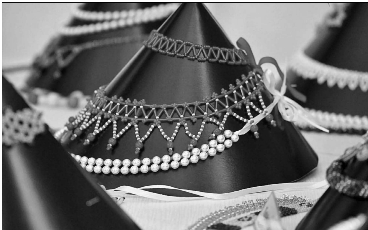
Kiállított gyöngy alkotások

Nem hiába nevezte a csipkét a textilművesség királynőjének Mátray Magdolna, a Népművészet Mestere, Király Zsiga-díjas csipkekészítő. Bizony akadt olyan szakkör is, amely kihívások elé állított minket: a csipkeverésben megtalálható