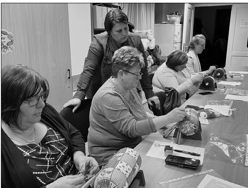
A mentorálás nem csak elméleti volt