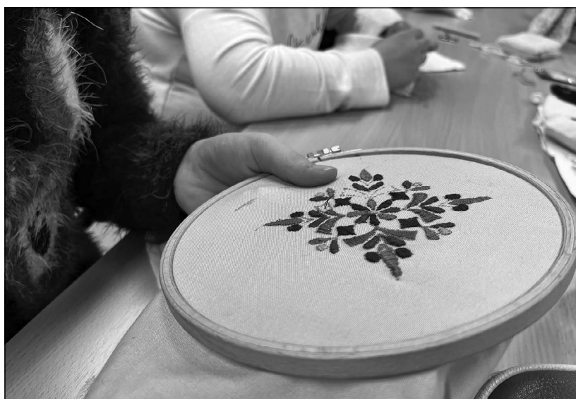
Hímző szakkör a településen

legesen azokat; tehát fontos volt, hogy ne lépjük át a határvonalat: megmaradjunk szakkörszervezőnek és ne vegyük át a szakkörvezetői szerepet. Így alapvető feladattá vált megtalálni az egyensúlyt, hogy tudatos, figyelmes szervezőként együtt lélegezzünk a szakkörökkel, érezzük a dinamikájukat, észrevegyük, mikor van szükség a csoport tagjainak támogatásra, és ekkor felkaroljuk, segítsük őket, de a foglalkozások levezénylését hagyjuk meg a szakkör vezetőjének. Mindemellett nagyon fontos, hogy a szakkörszervező a háttér biztosításán túl kísérje a csoportot és segítse hozzá, hogy közösséggé váljon – ez egy olyan folyamat, amelyet csak a gyakorlatban lehet elsajátítani és megtanulni.