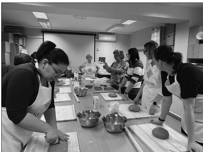
A tapasztaltabbak segítették a kezdő mézeskalácsosokat

2021 ősze egy intenzív tanulási folyamat volt, ugyanis már az előkészítő munkálatok során átgondoltan kellett meghatározni, hogy kik azok, akik szervezik a foglalkozásokat, és kik valósítják meg tény-