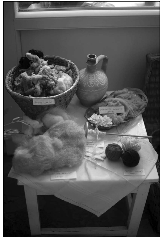
A gyapjú színezésének útja

A fenti példa is jól mutatja, hogy egy kistelepülés életében sokszor a betelepülők lehetnek azok, akik új szint hoznak a közösség életébe. Új nézőpontokat feltárva irányíthatják a község lakosainak a figyelmét azokra az értékekre, melyeknek feltárása és megőrzése nagyban hozzájárul a település közösségmegtartó erejéhez.