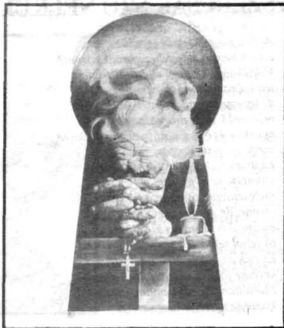
Molnos Zoltán: IMA

— Volt egy Vas Károly nevű ember. Annak meghalt a felesége, s ott maradt a leányaival. De olyan boldogtalanformák voltak azok. S aztán egy fejszével úgy megkoppintotta őket, hogy meghóttak. S azután is mind csúfolták: „Na, ügyelj, mer úgy jársz, mind Károly báty leányai!” De aztán megütötte a gutta. Ez is olyan bódogtalanforma vót.