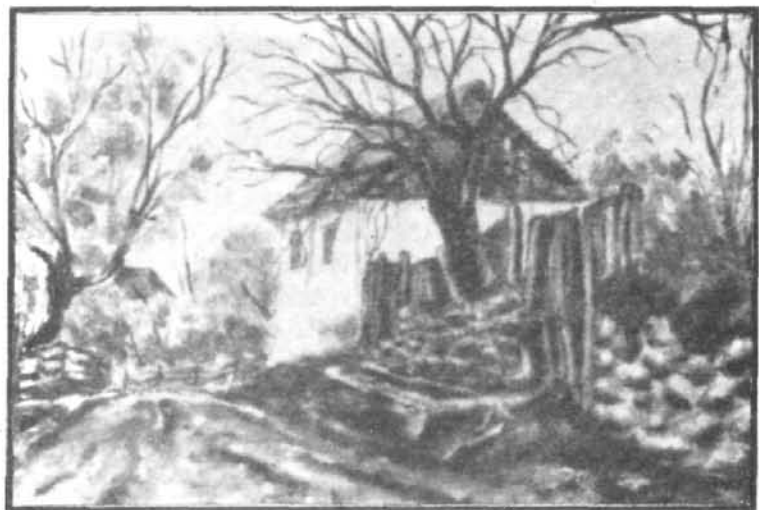
Jakab Csaba: GYEPESI HÁZ

*Nagy Olga: Világgá futó szavak . Szépirodalmi könyvkiadó, Budapest, 1990.