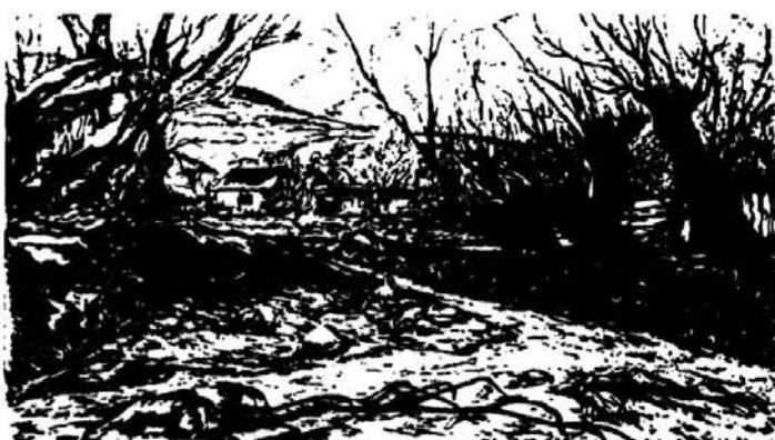
Jakab Csaba: Gyepesi füzek