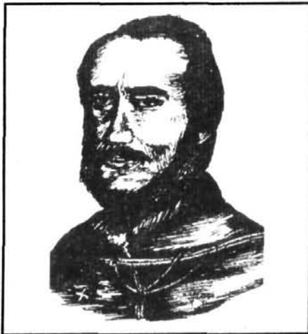
Jakab Csaba: SZÉCHENYI

Az osztrák titkosrendőrség zaklatásai és fenyegetései elől Széchenyi 1860. április 8-án öngyilkosságba menekült. Az egész országban végtelen sorban rendezték a gyászünnepségeket, amelyek hazafias tüntetésekké váltak.